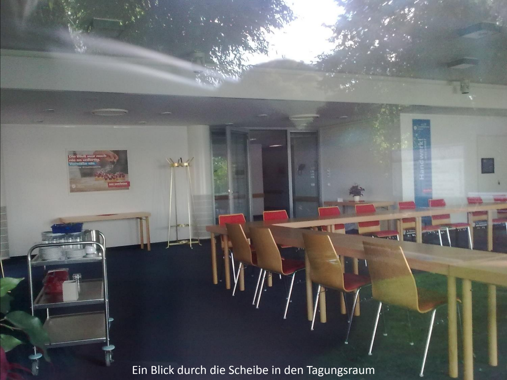
Ein Blick durch die Scheibe in den Tagungsraum