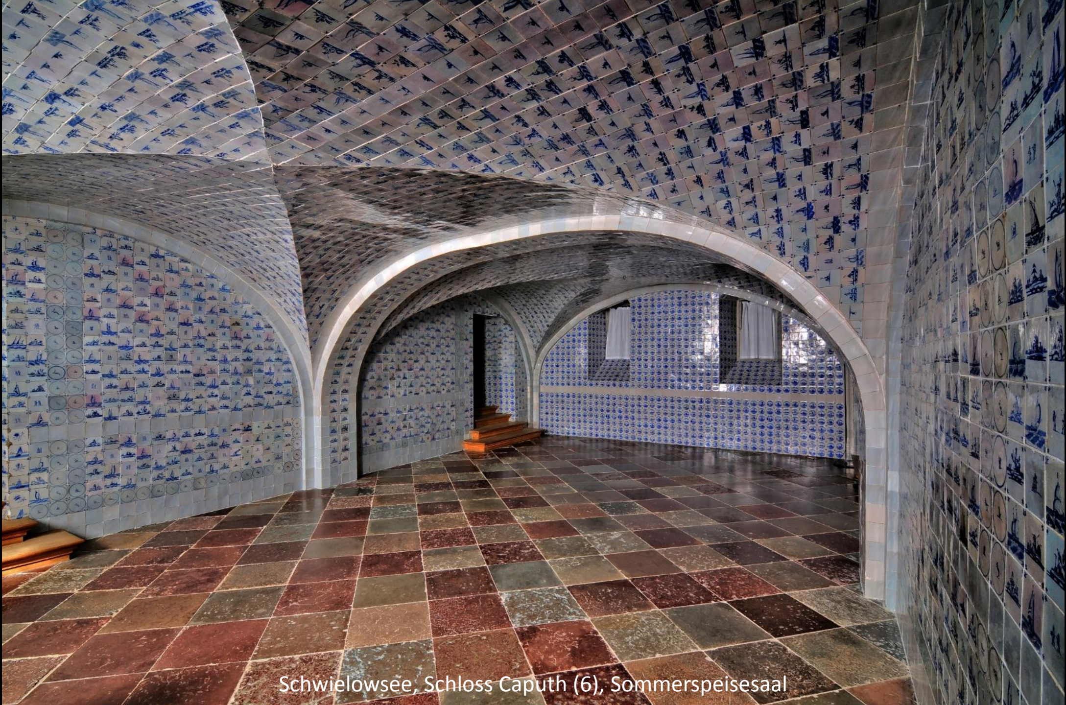
Schwielowsee, Schloss Caputh (6), Sommerspeisesaal