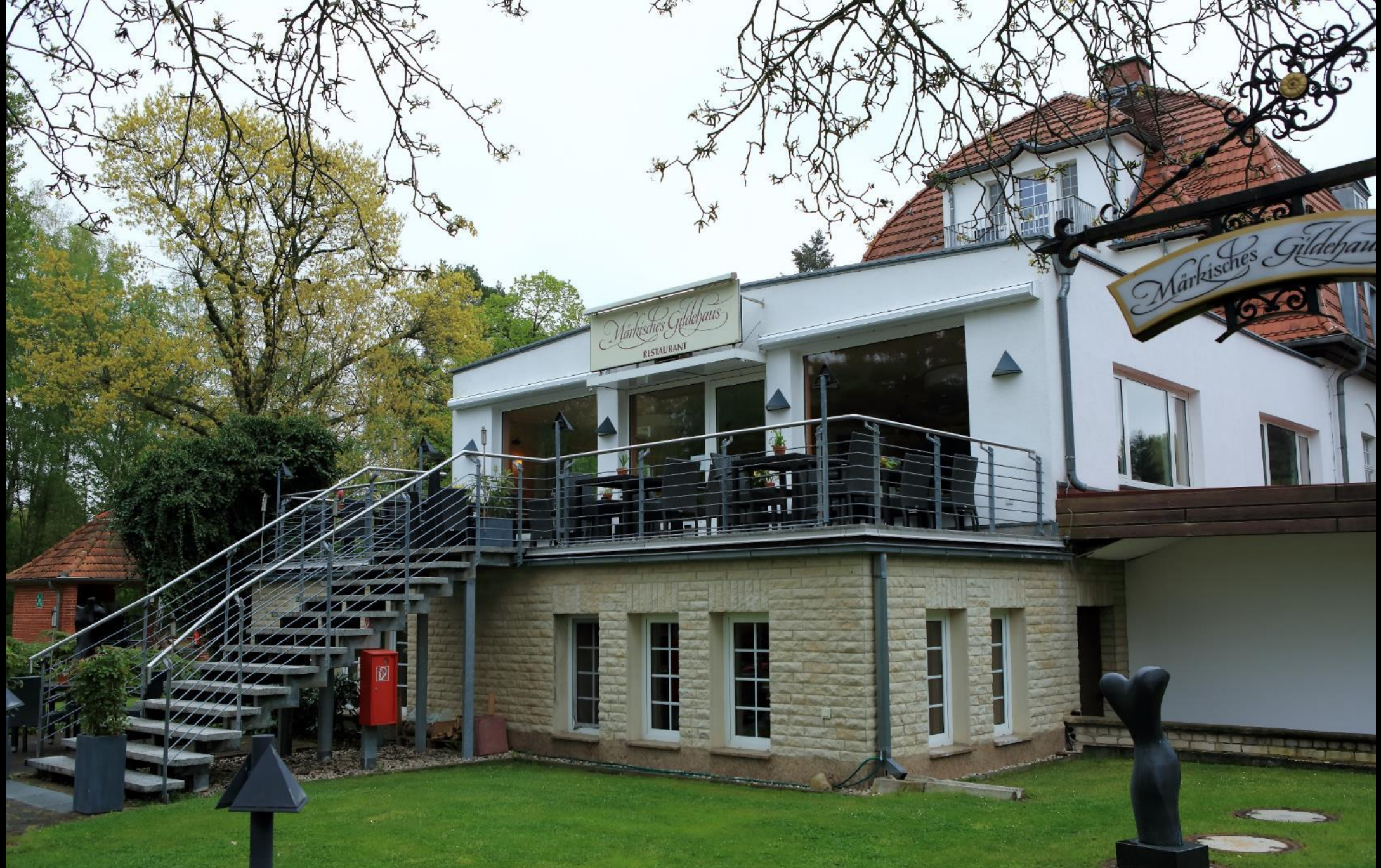
Restaurant des Hotels