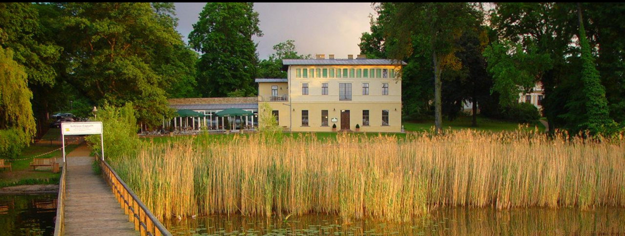
Schwielowsee, Schloss Caputh (8), Kavalierhaus Seeseite