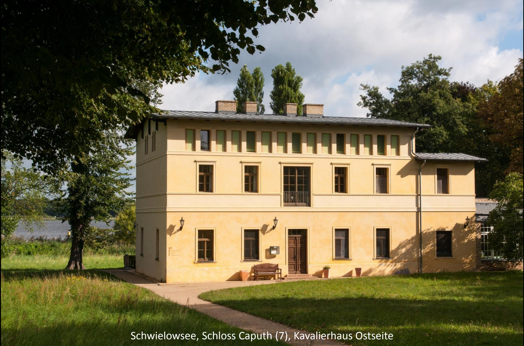
Schwielowsee, Schloss Caputh (7), Kavalierhaus Ostseite