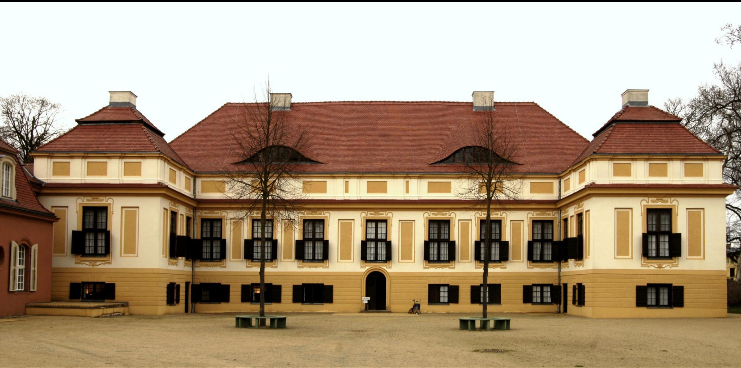
Schwielowsee, Schloss Caputh (2), Ortsseite