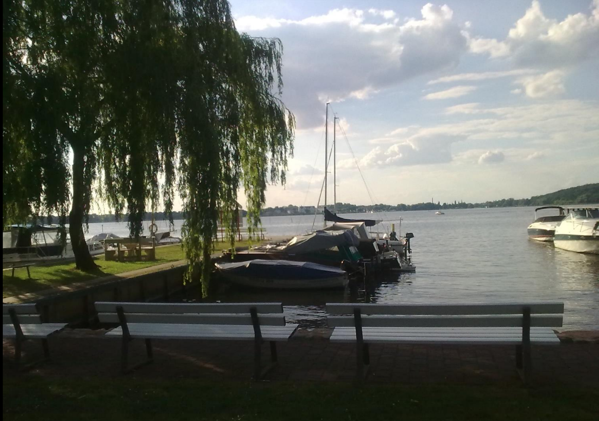
Schwielowsee, Bootsanleger des Hotels (3)