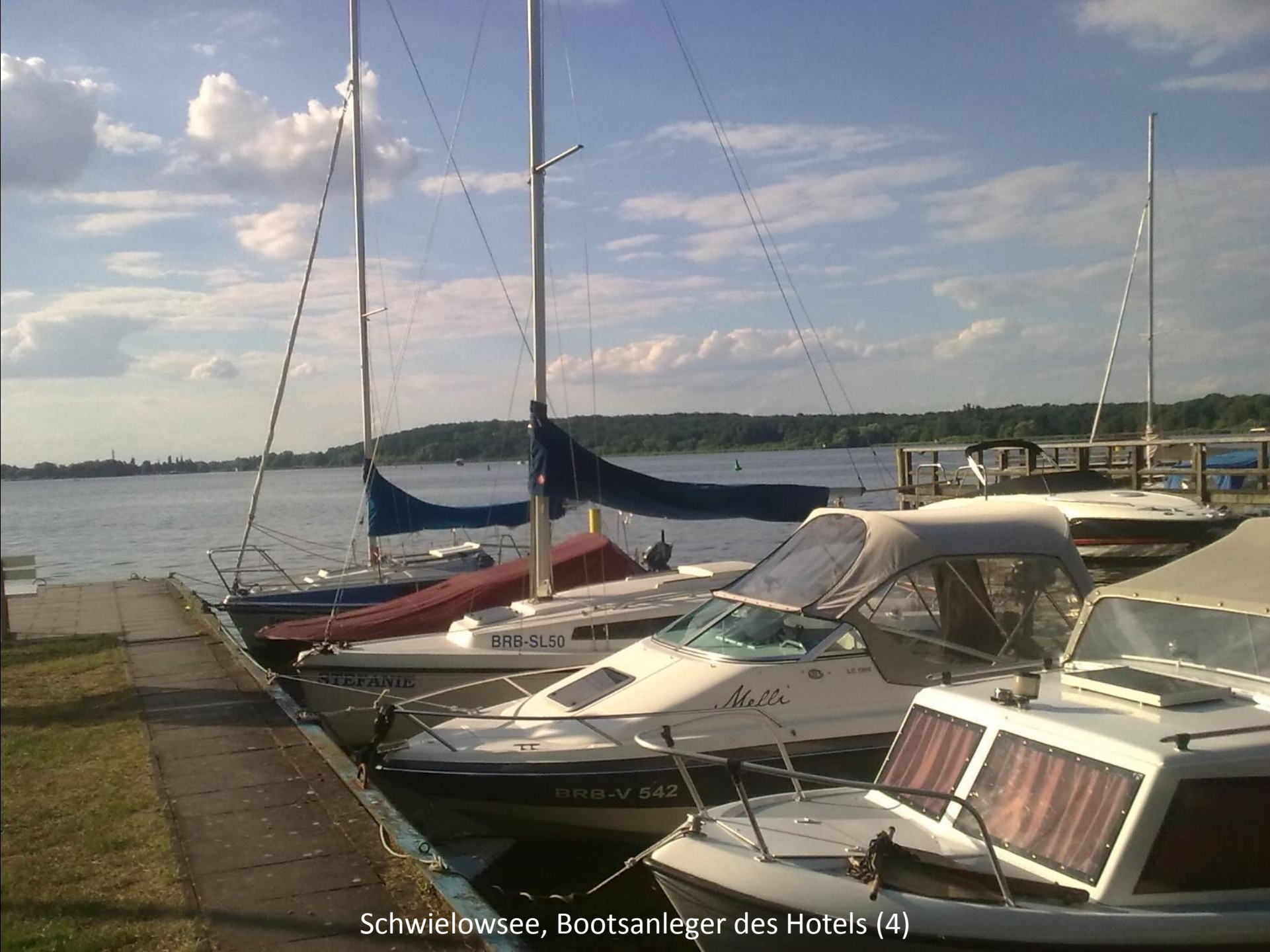
Schwielowsee, Bootsanleger des Hotels (4)