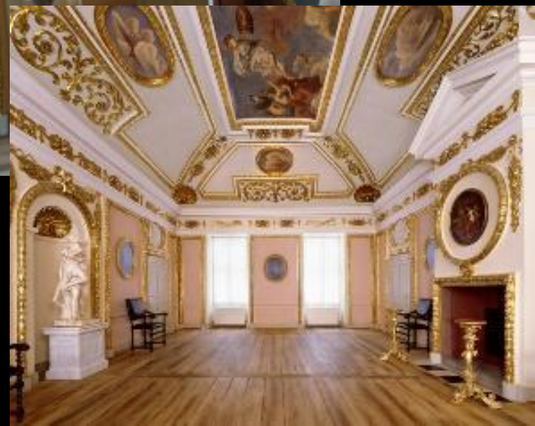
Schwielowsee, Schloss Caputh (5), Festsaal