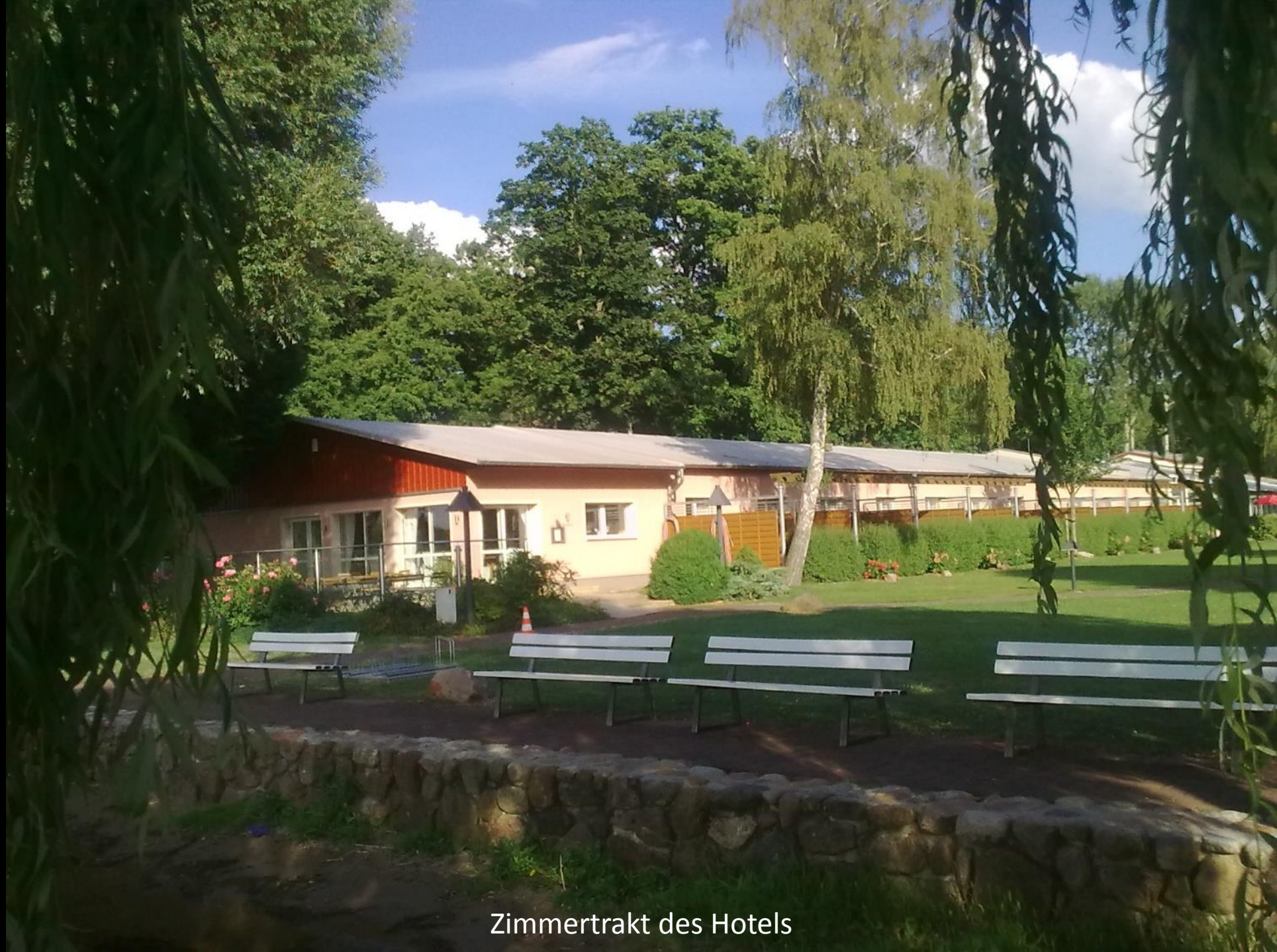
Zimmertrakt des Hotels