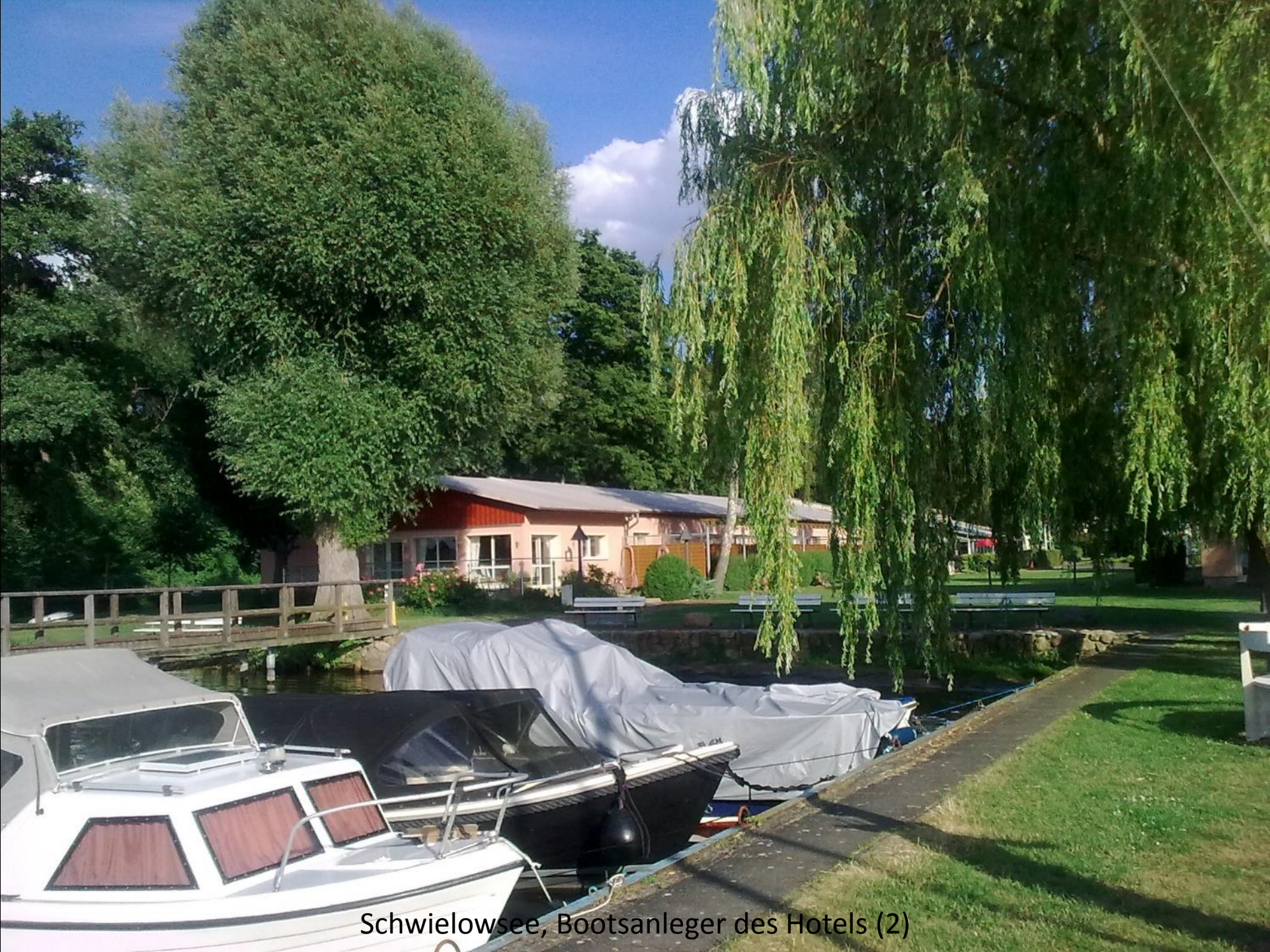
Schwielowsee, Bootsanleger des Hotels (2)