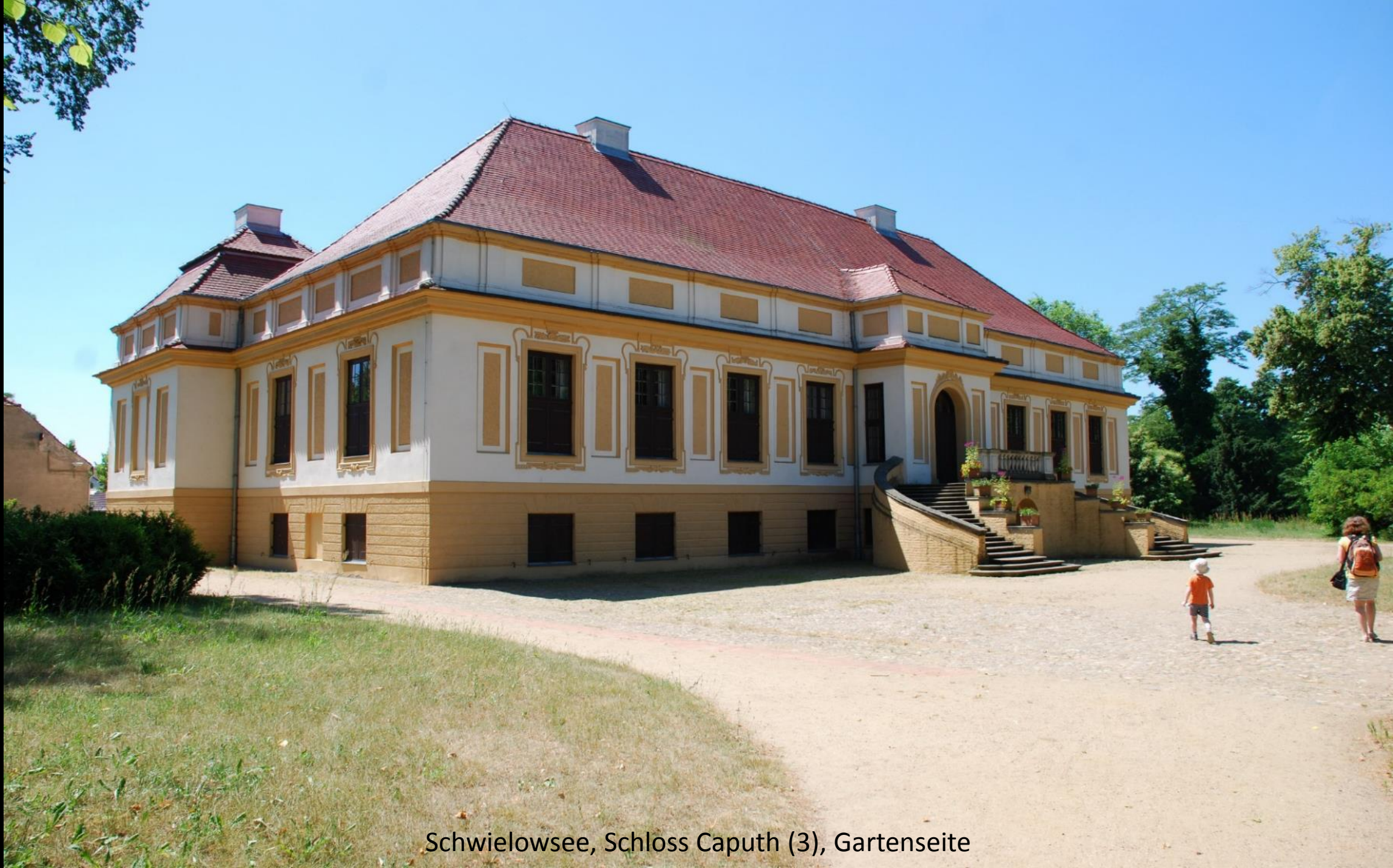
Schwielowsee, Schloss Caputh (3), Gartenseite