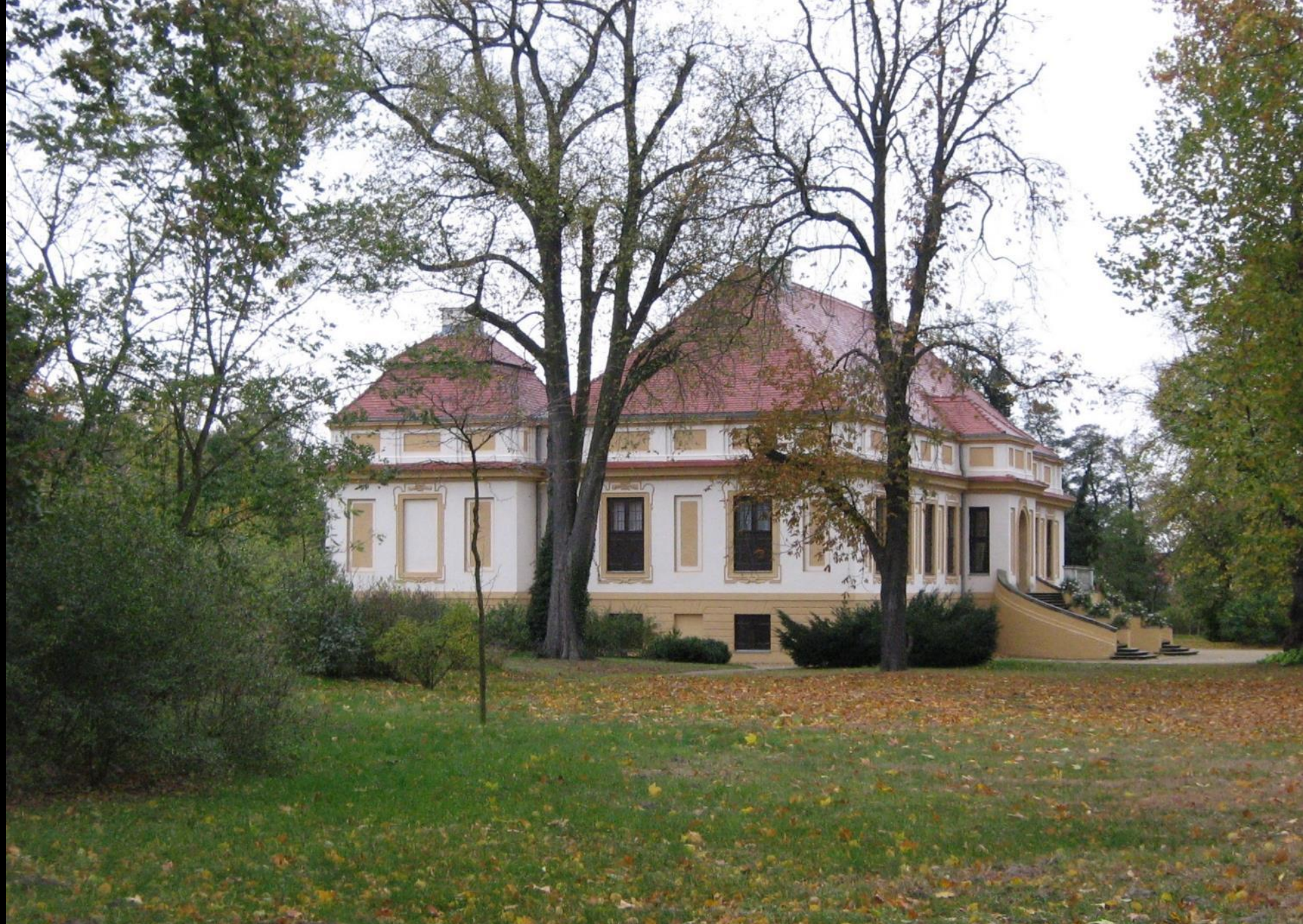
Schwielowsee, Schloss Caputh (4), Nord- und Gartenseite