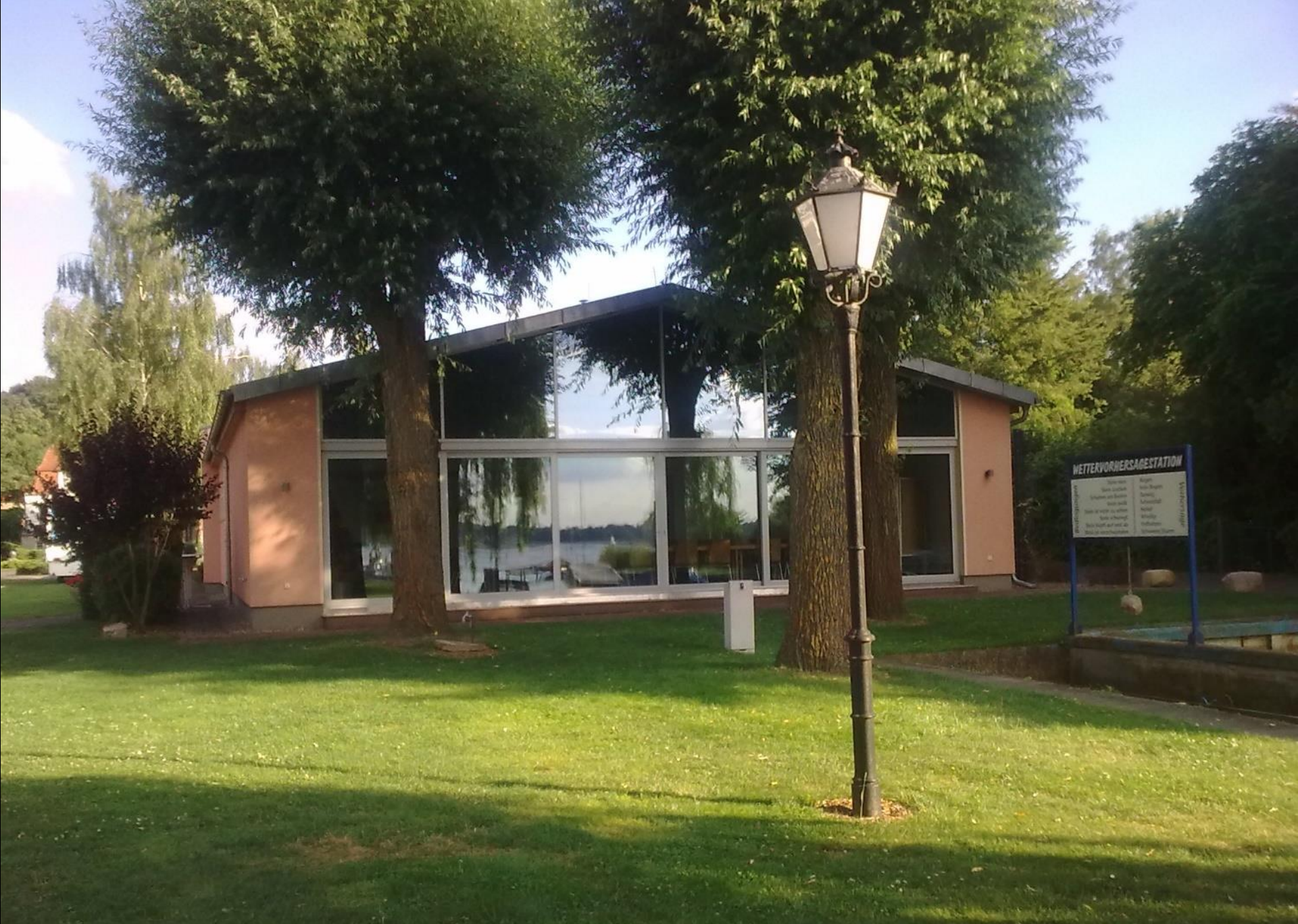
Der Tagungsraum vom Bootsanleger gesehen