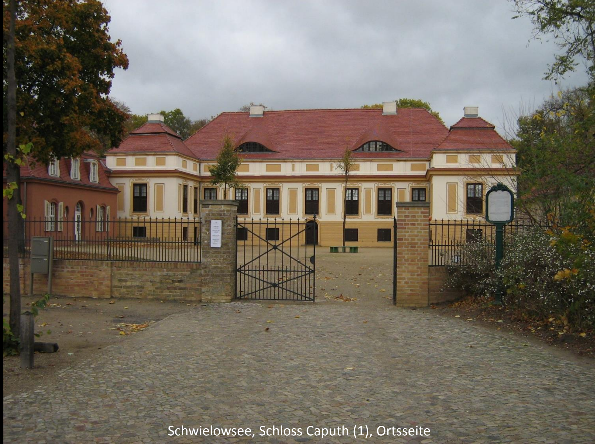
Schwielowsee, Schloss Caputh (1), Ortsseite