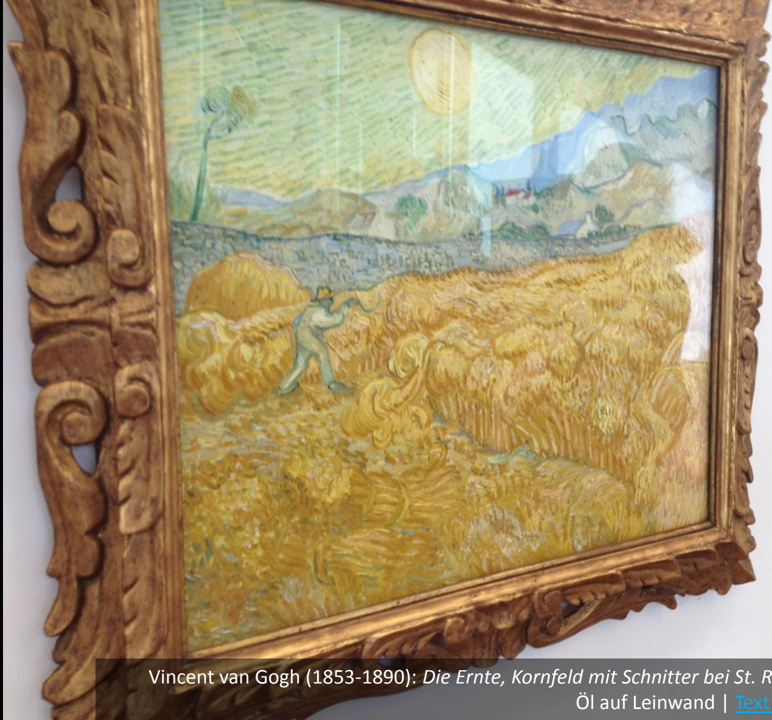
Vincent van Gogh (1853-1890): Die Ernte, Kornfeld mit Schnitter bei St. Remy , 1889