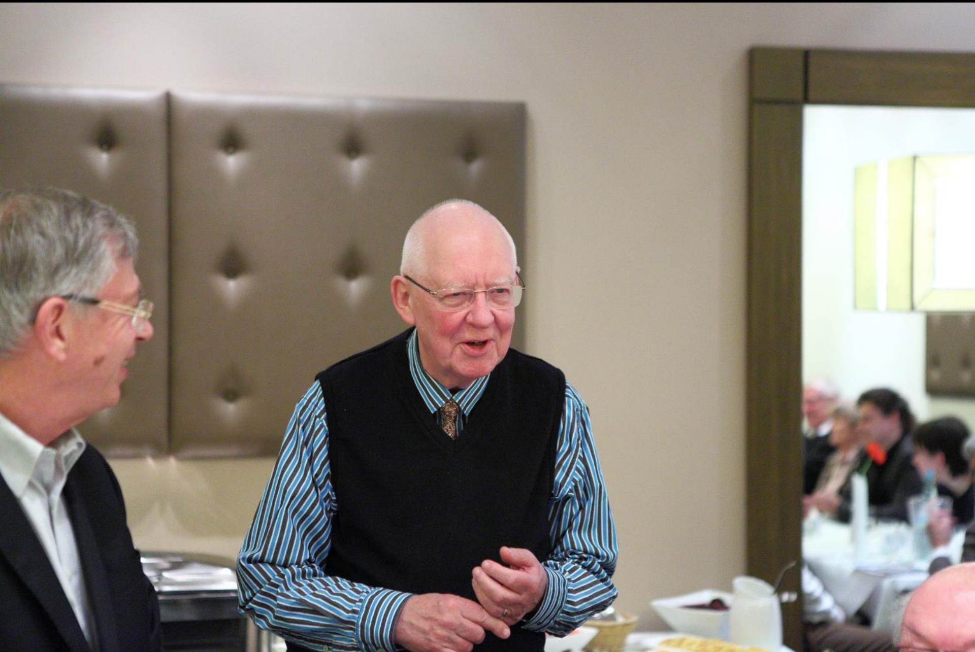
Vor dem Abendessen noch ein Wort des Präsidenten