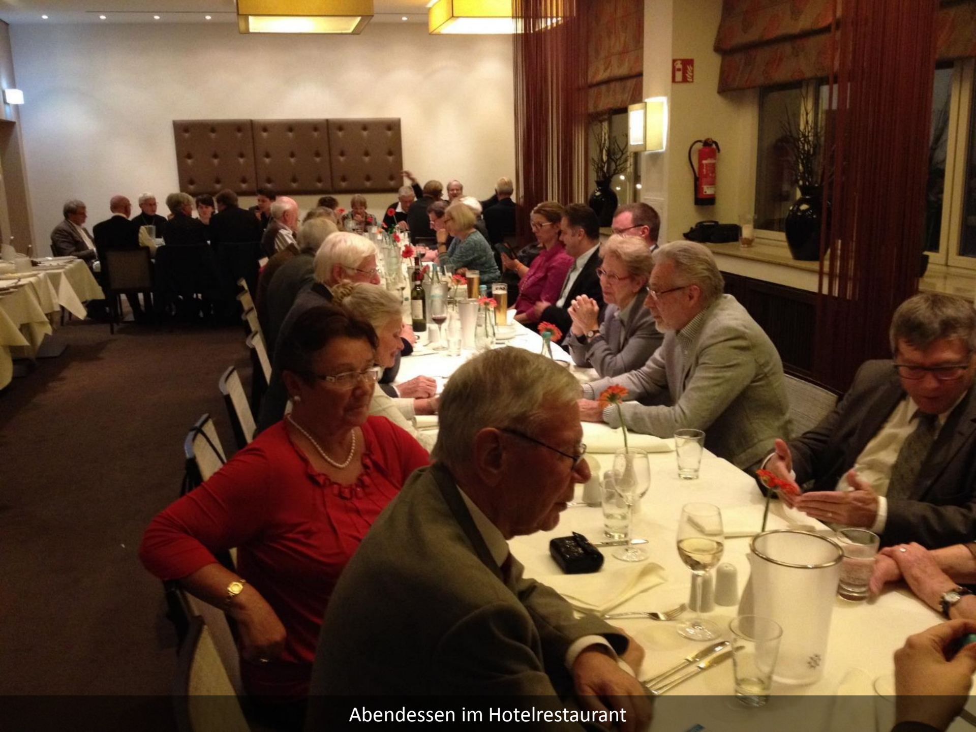
Abendessen im Hotelrestaurant