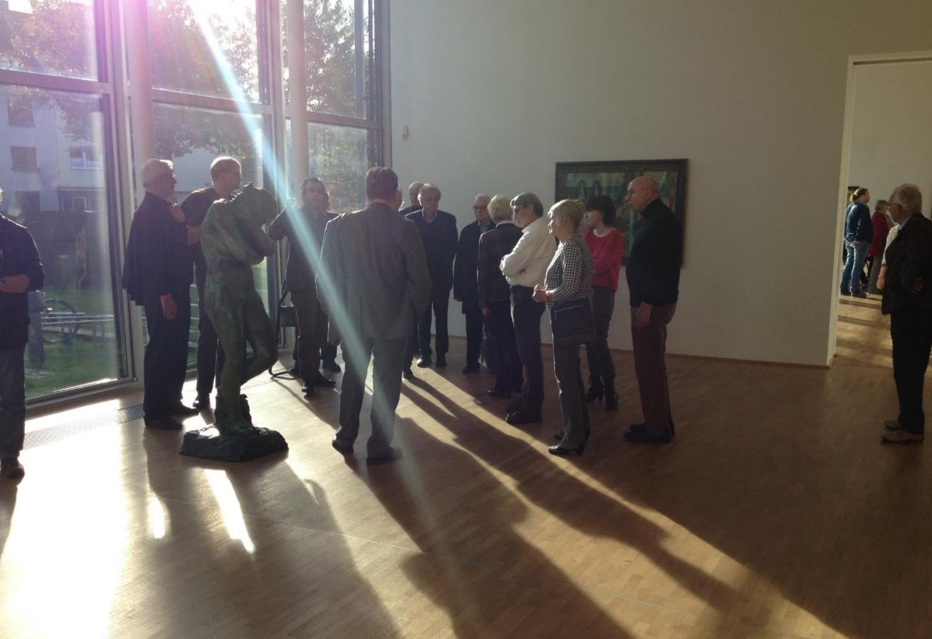
Gruppe B vor dem Gemälde Bretonische Tangsammlerinnen (II) , 1889, von Paul Gauguin.