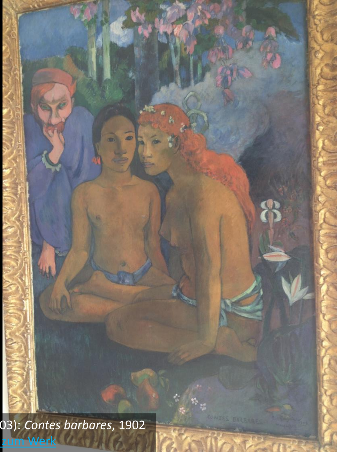
Paul Gauguin (1848-1903): Contes barbares , 1902 Öl auf Leinwand | Text zum Werk