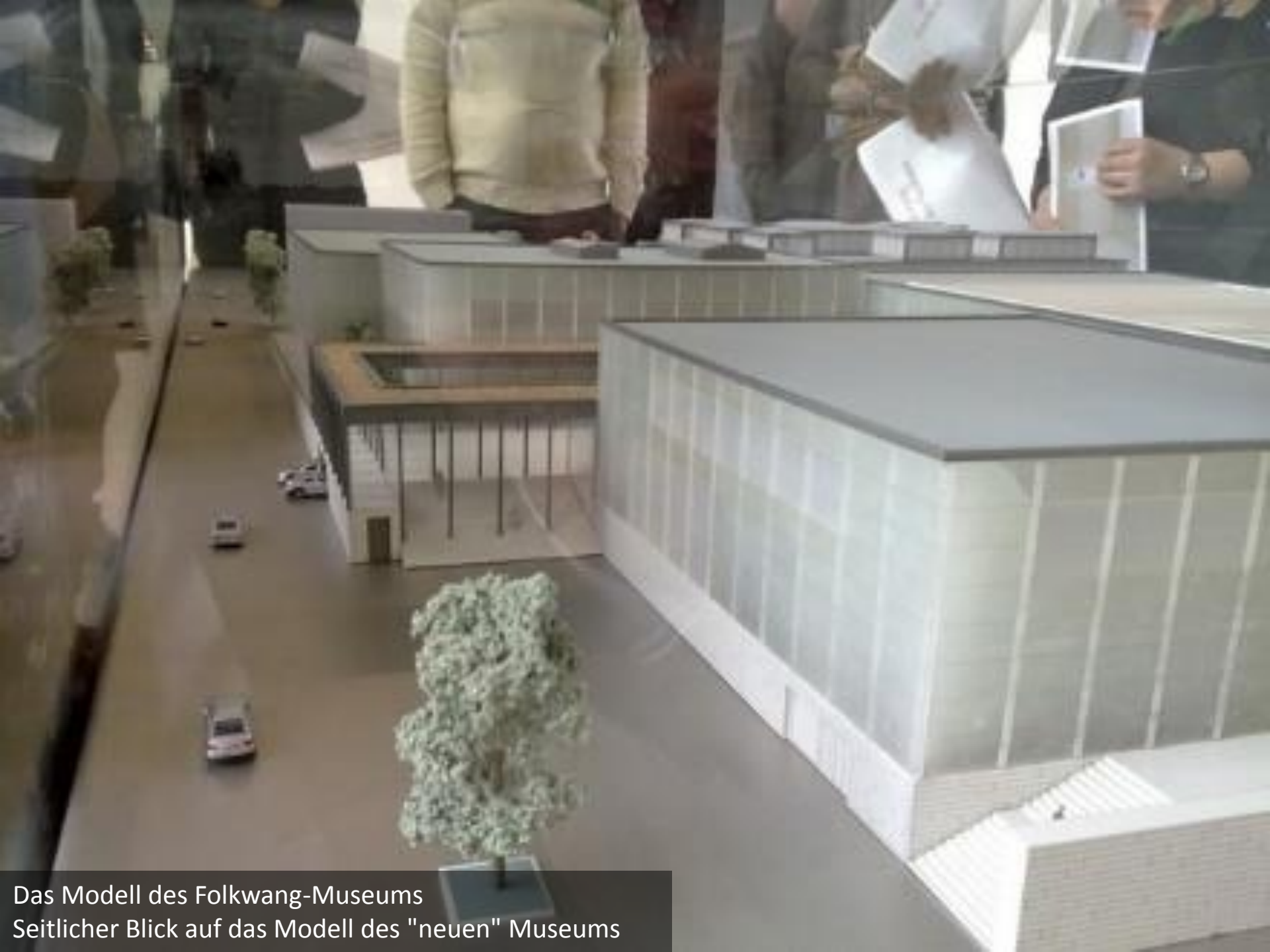
Das Modell des Folkwang-Museums Seitlicher Blick auf das Modell des "neuen" Museums