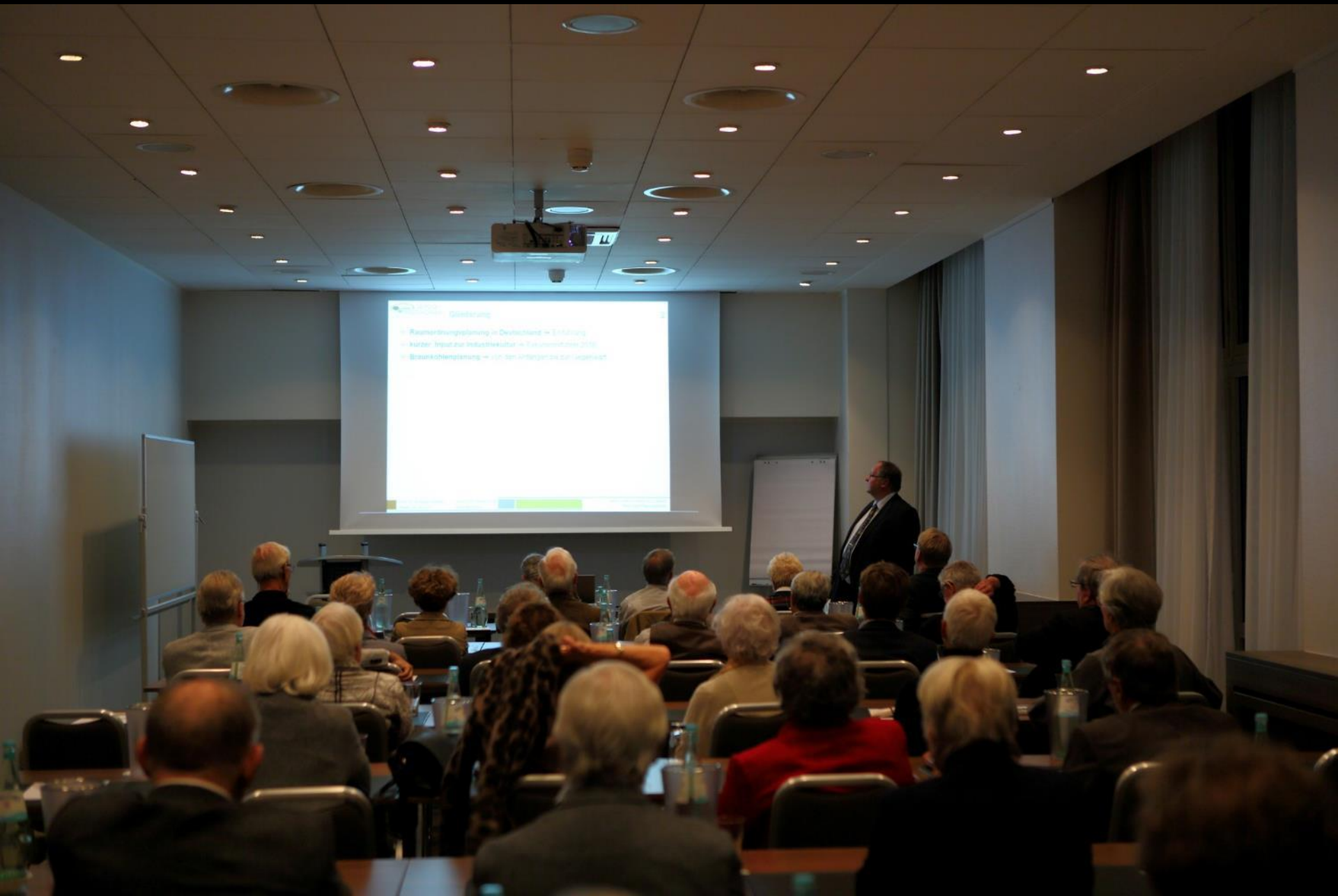
Der Konferenzraum im Tagungshotel