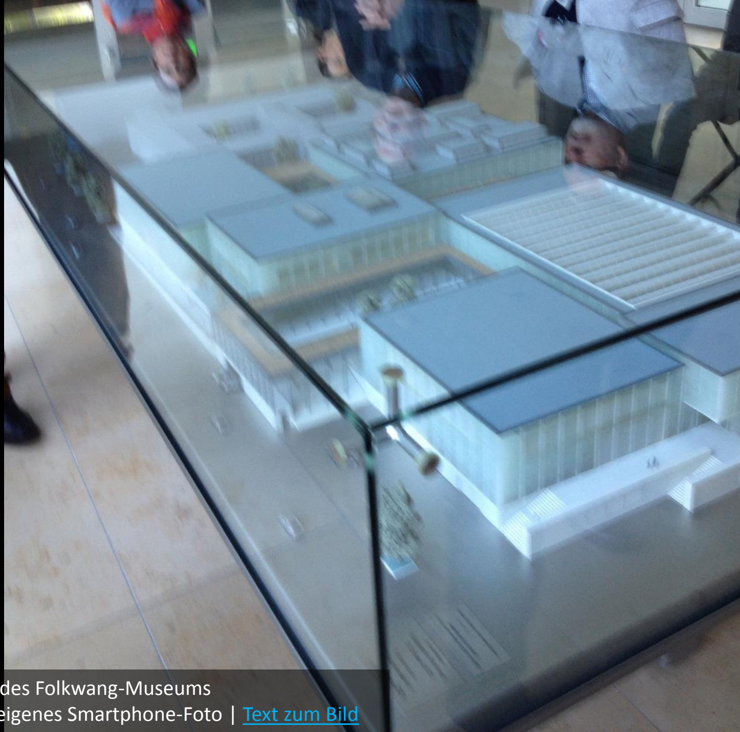
Das Modell des Folkwang-Museums unscharfes eigenes Smartphone-Foto | Text zum Bild