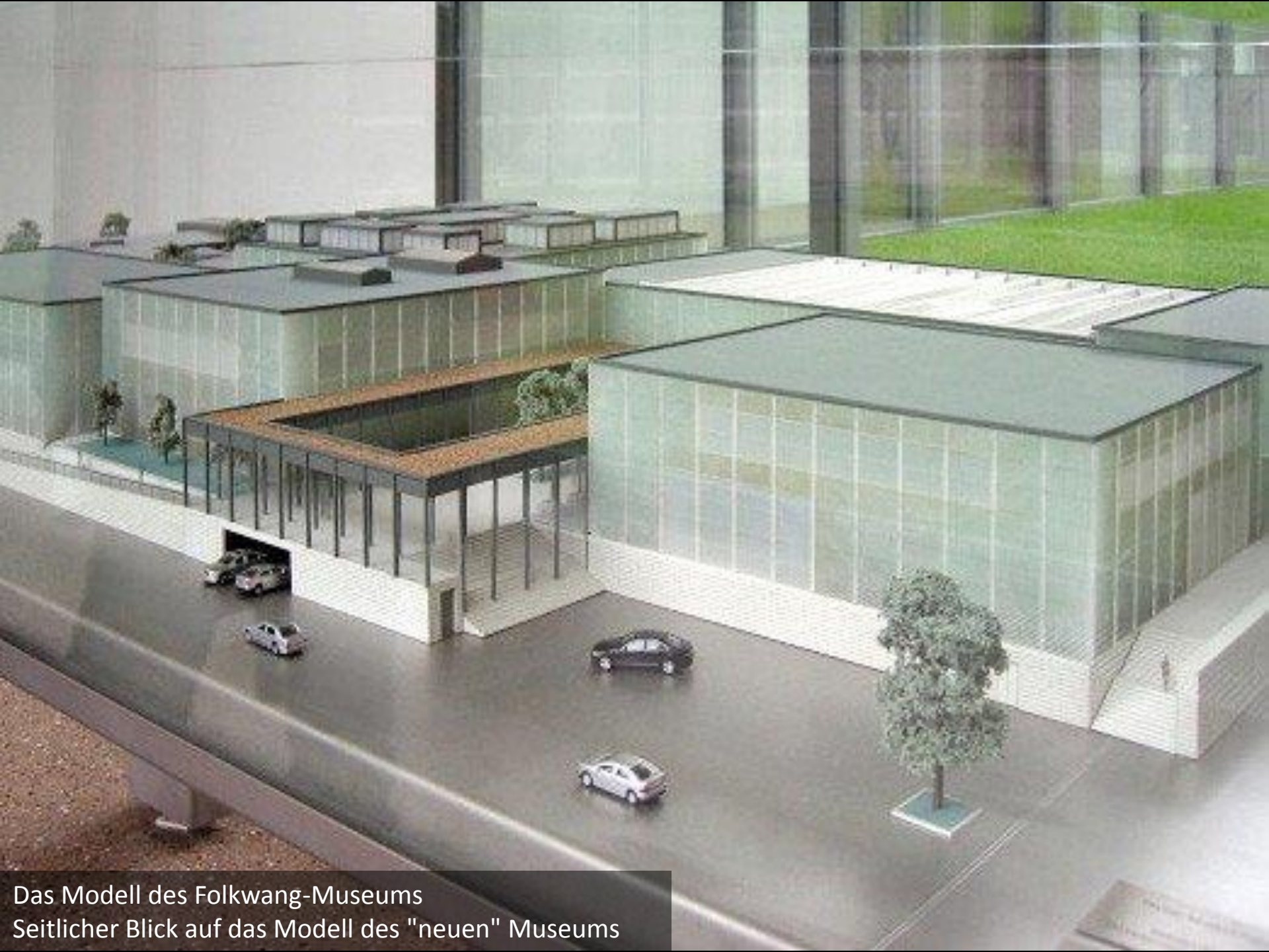
Das Modell des Folkwang-Museums Seitlicher Blick auf das Modell des "neuen" Museums