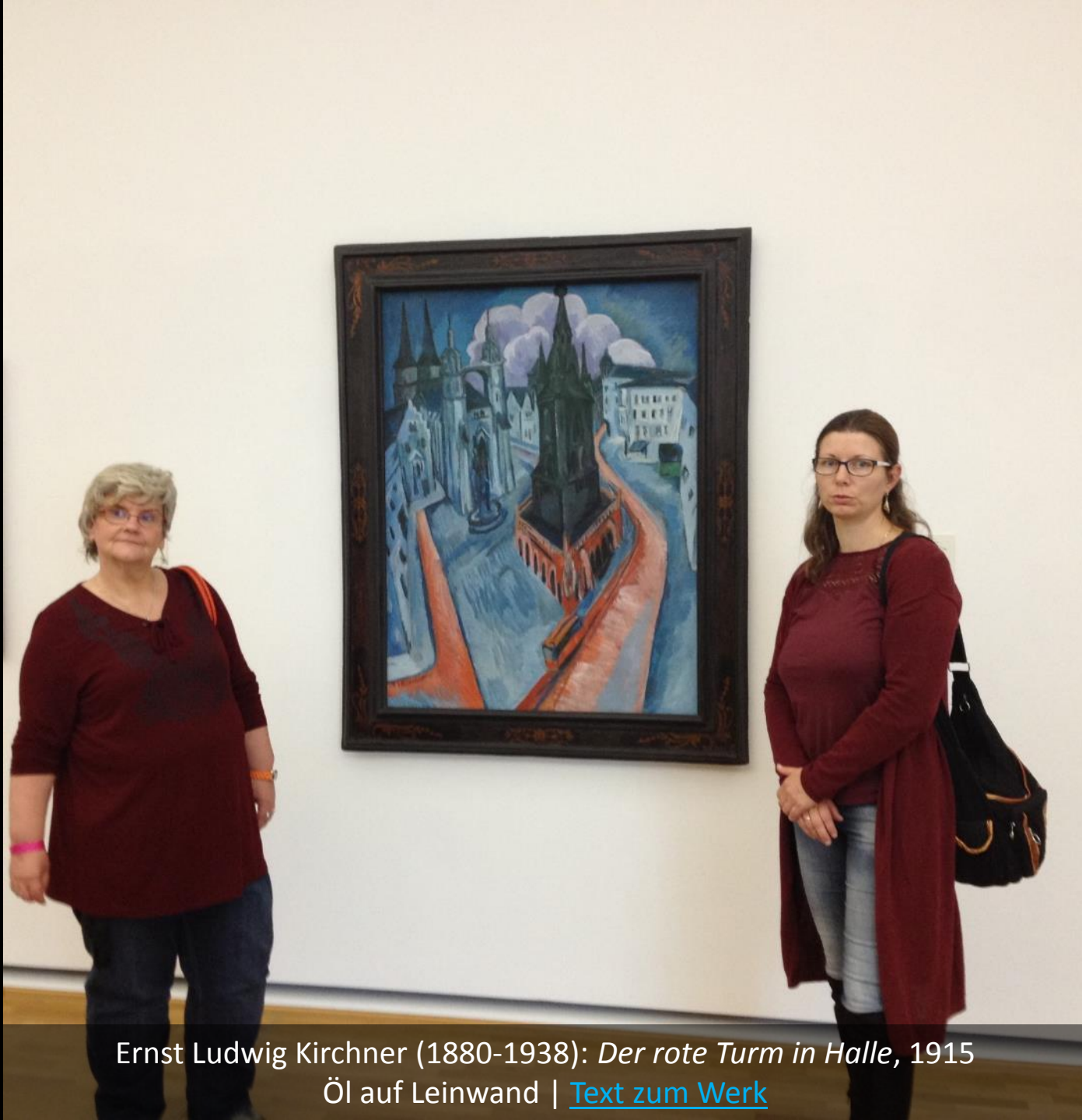
Ernst Ludwig Kirchner (1880-1938): Der rote Turm in Halle , 1915 Öl auf Leinwand | Text zum Werk