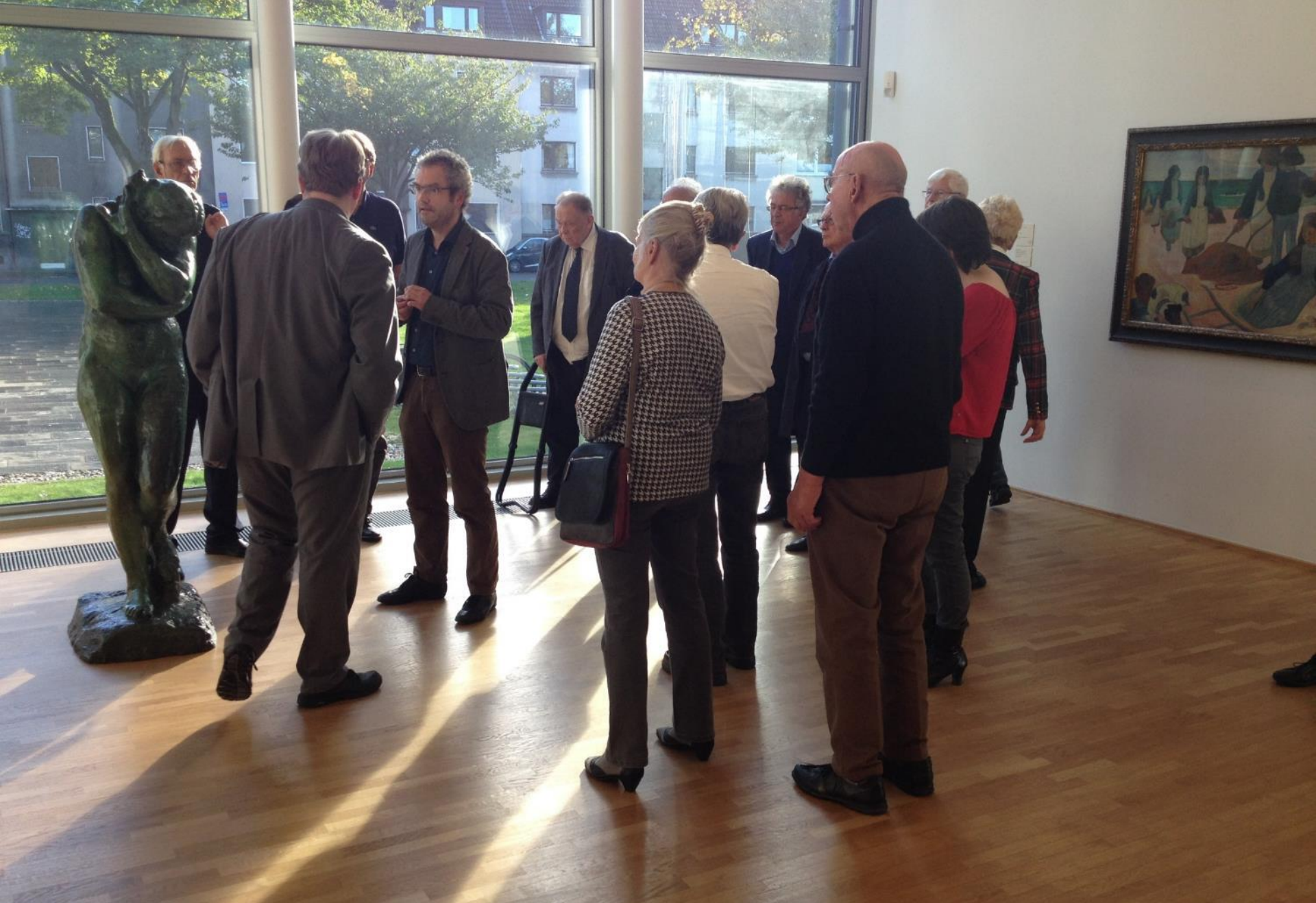
Gruppe B vor dem Gemälde Bretonische Tangsammlerinnen (II) , 1889, von Paul Gauguin.