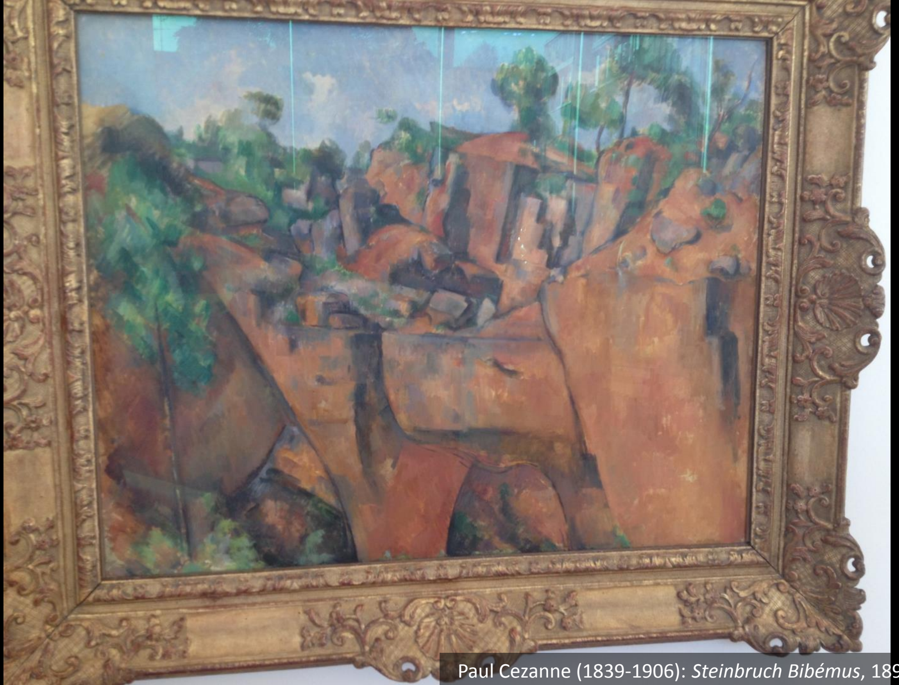
Paul Cezanne (1839-1906): Steinbruch Bibémus , 1895