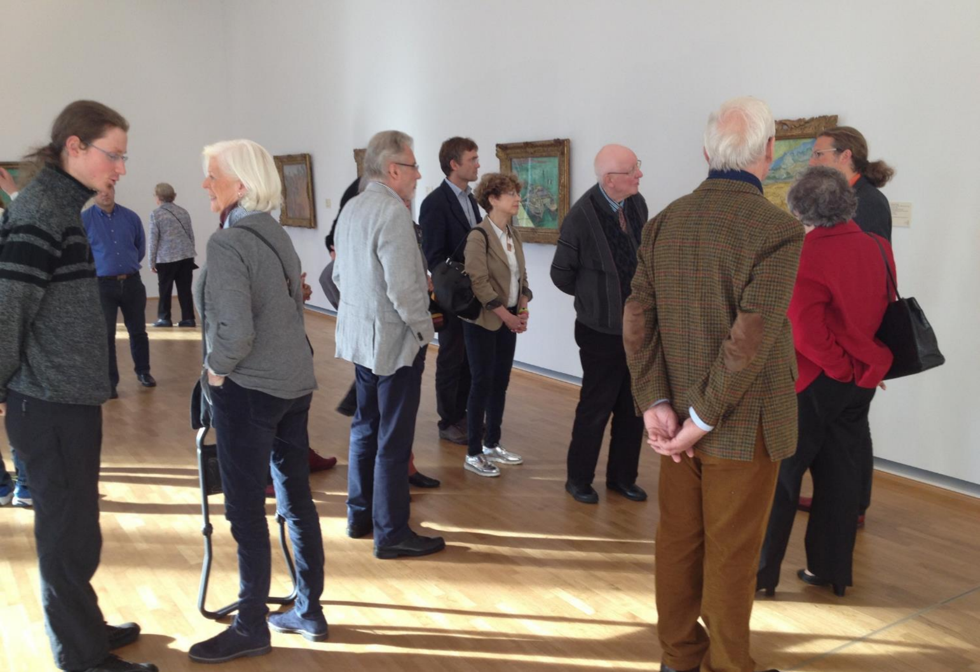
Der Museumsführer erläutert der Gruppe A das Gemälde Die Ernte, Kornfeld mit Schnitter bei St. Remy von Vincent van Gogh