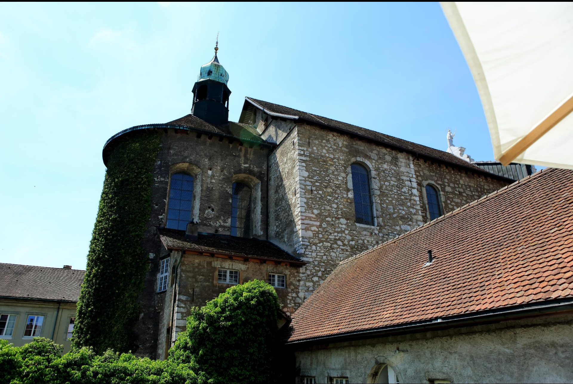
Chorseite der Jesuitenkirche