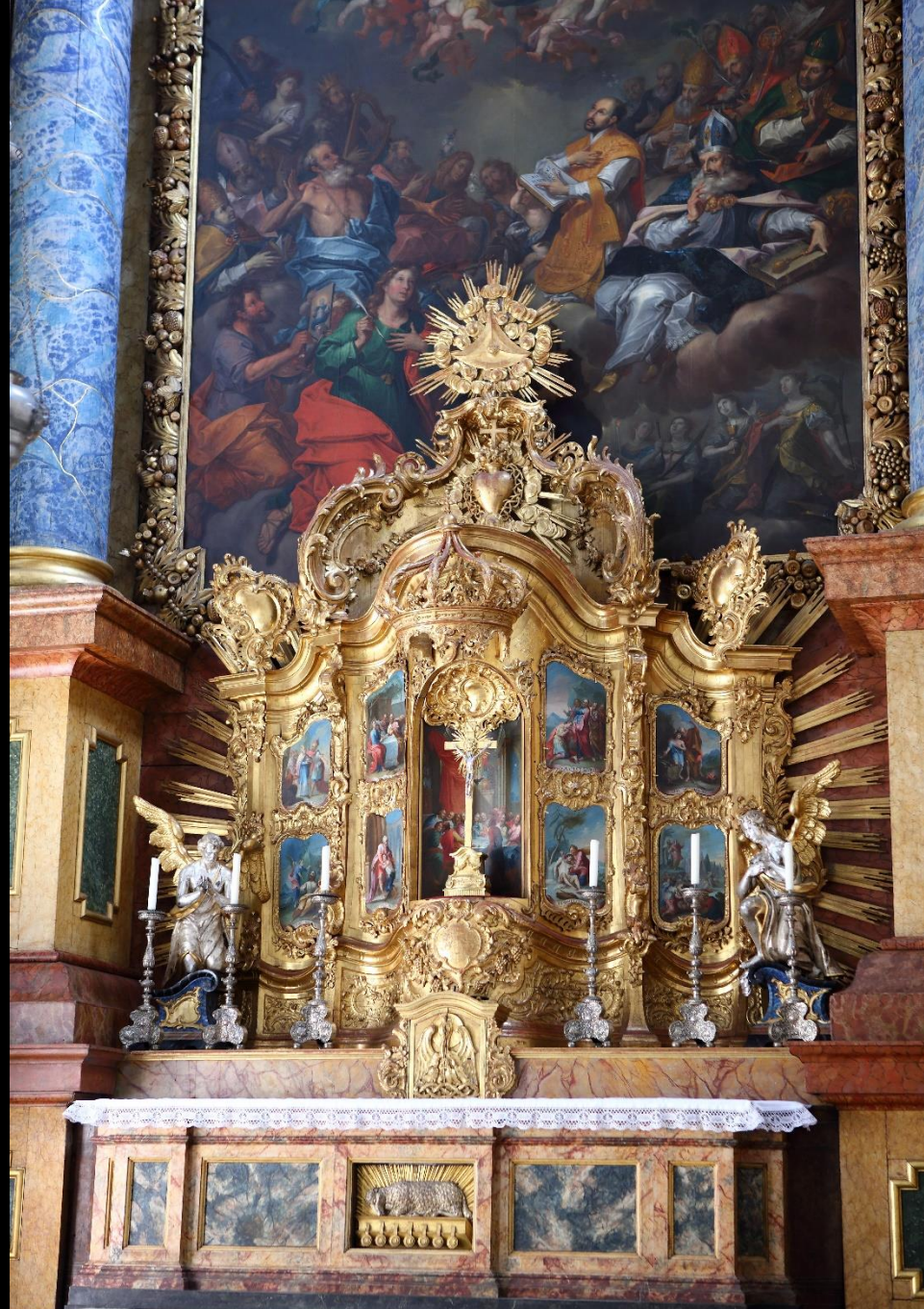
Der Hauptaltar der Jesuitenkirche