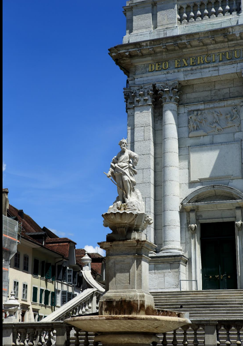
St. Ursenkathedrale, Figur am Treppenaufgang