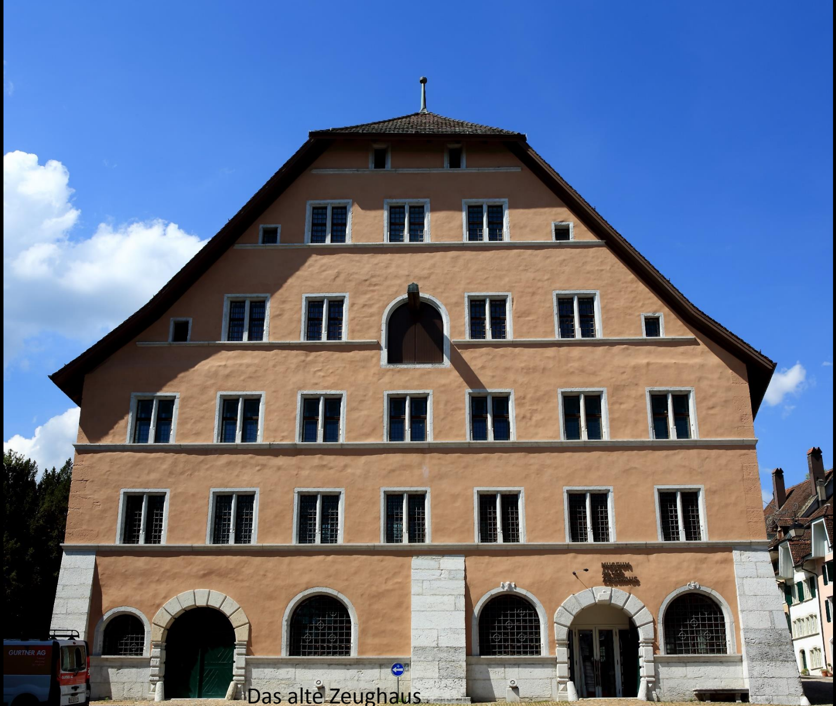
Das alte Zeughaus