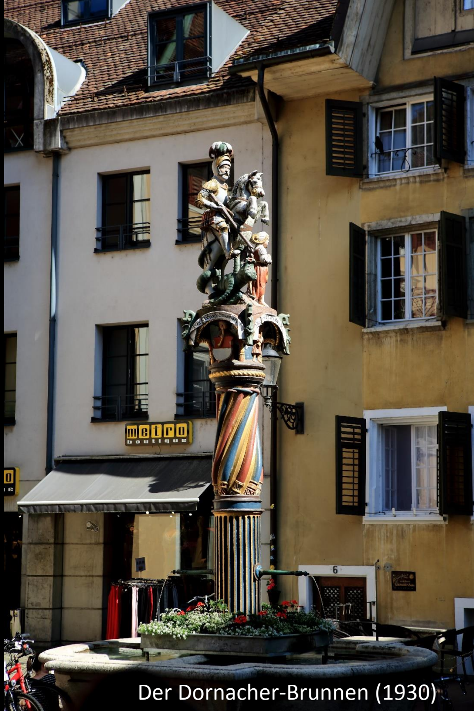
Der Dornacher-Brunnen (1930)