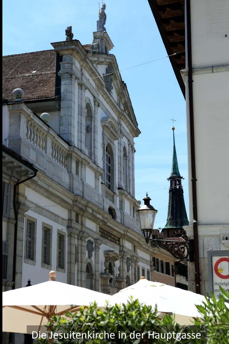
Die Jesuitenkirche in der Hauptgasse