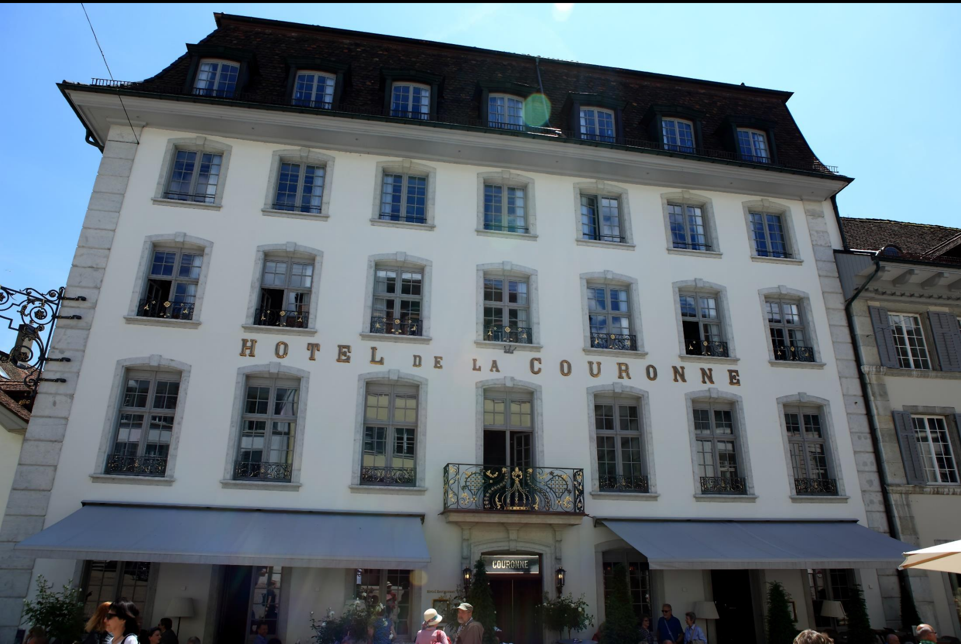
Hôtel de la Couronne