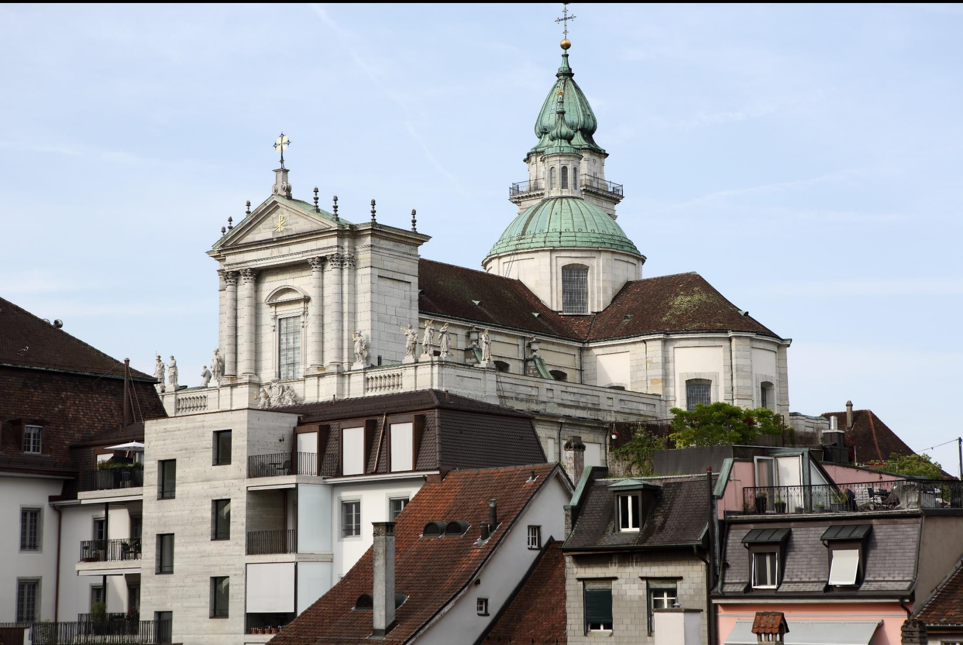
Die St. Ursenkathedrale thront über der Stadt