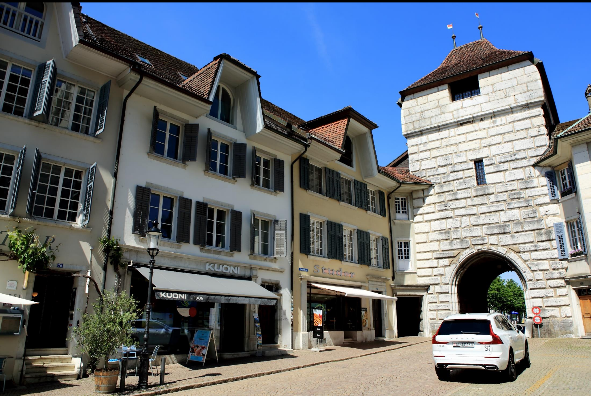
Das Baseltor, Innen-(Stadt-)Seite