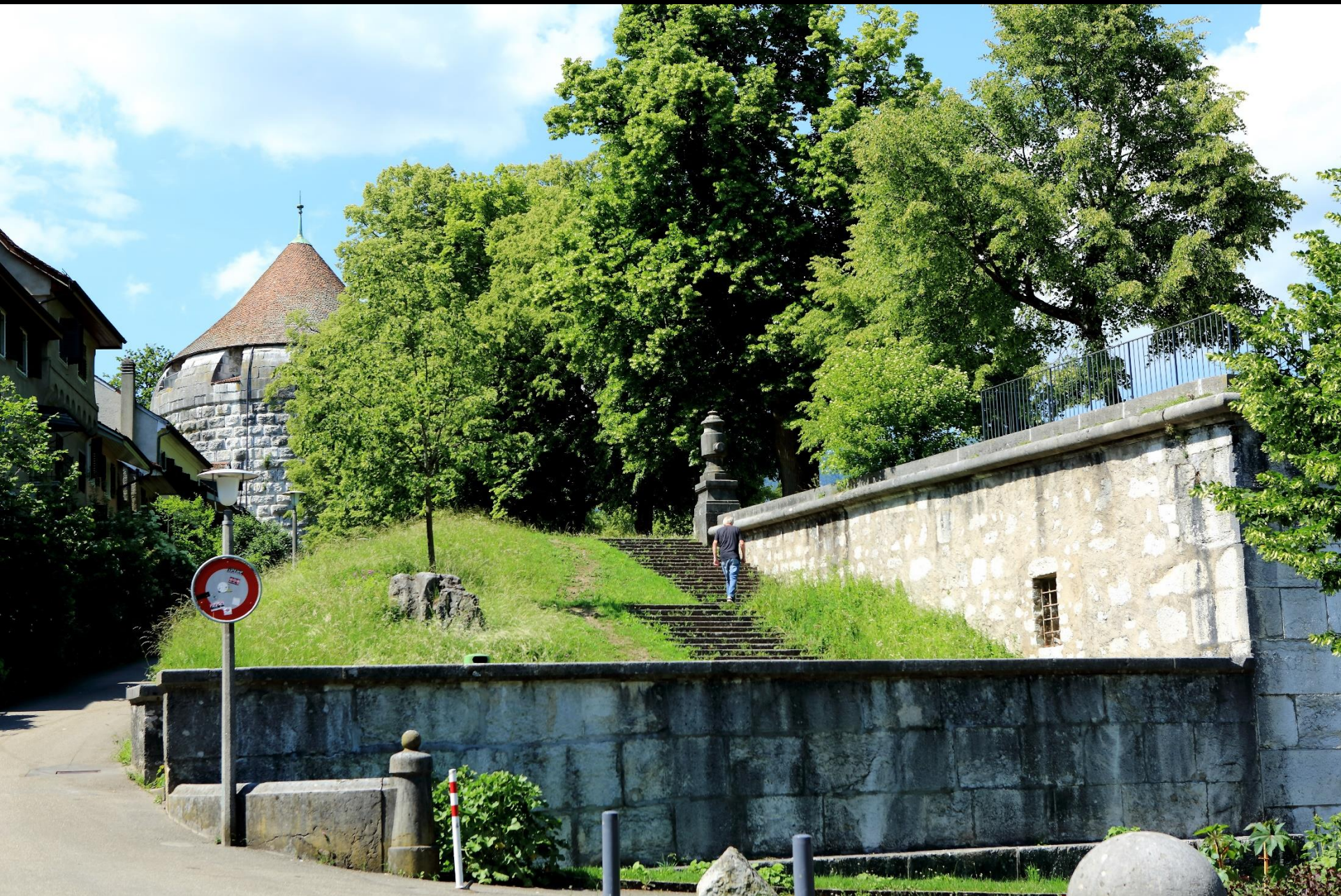
Reste der Stadtbefestigung vor dem Baseltor