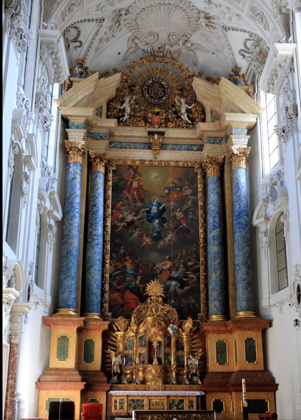
Der Hauptaltar der Jesuitenkirche