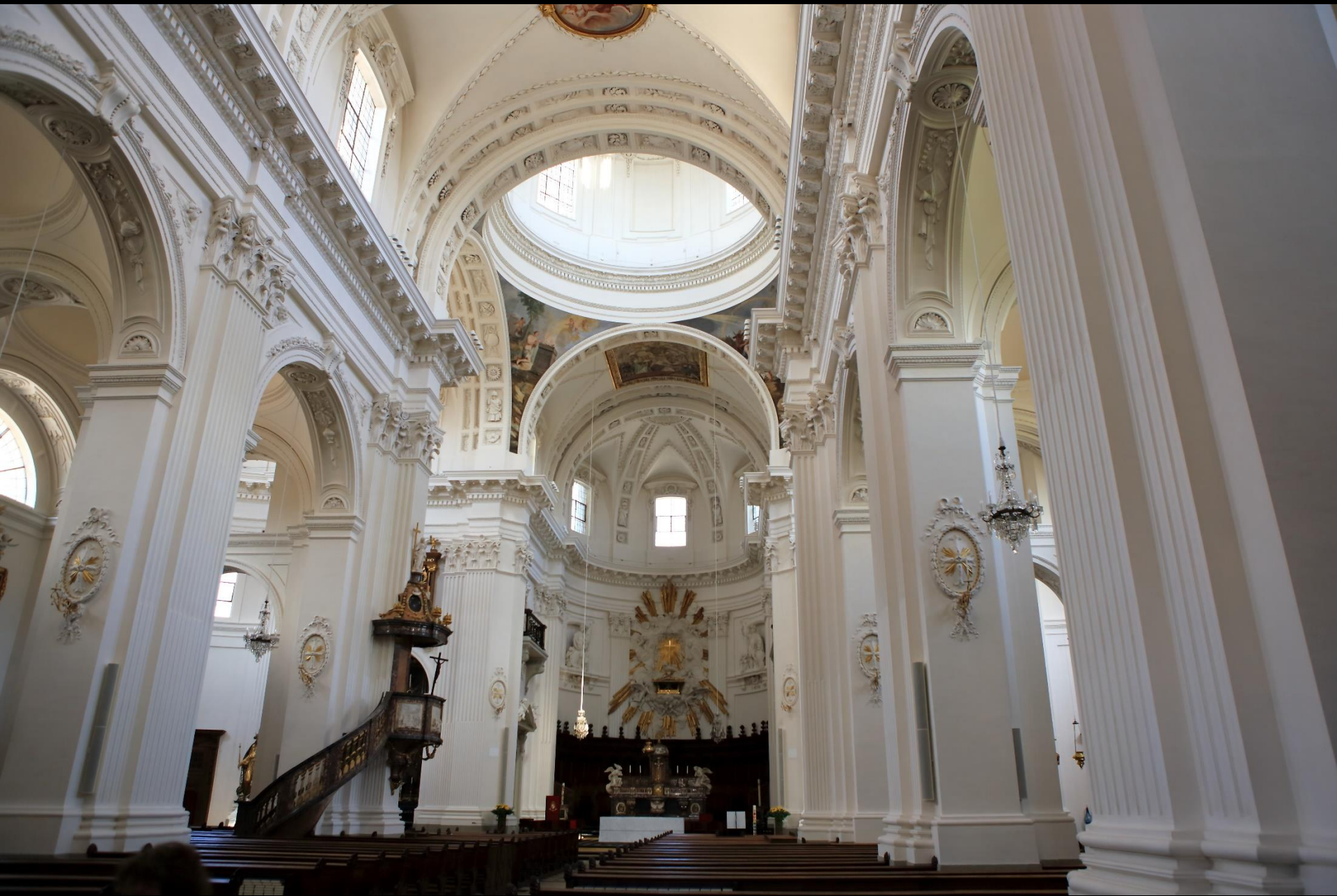
St. Ursenkathedrale, Mittelschiff