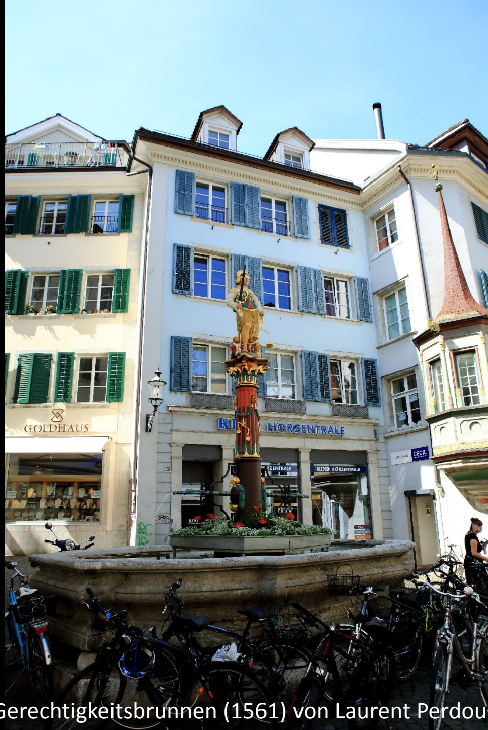
Gerechtigkeitsbrunnen (1561) von Laurent Perroud