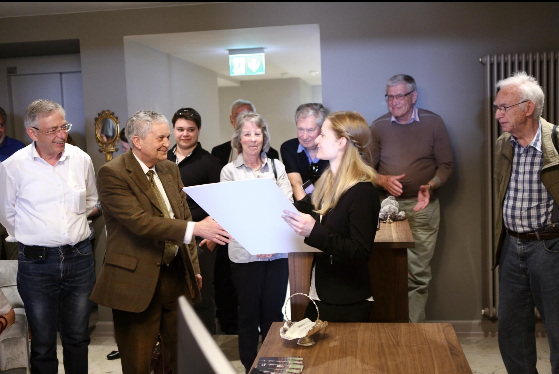
Vizepräsident, Herr Prof. Jug überreicht die Urkunde der Reservationschefin des Hôtels