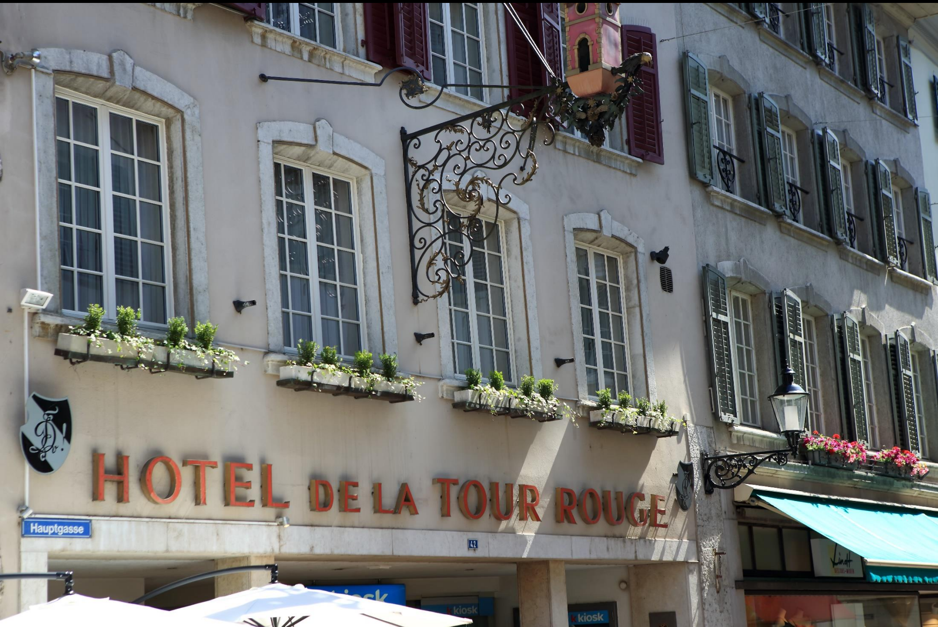
Hôtel de la Tour Rouge