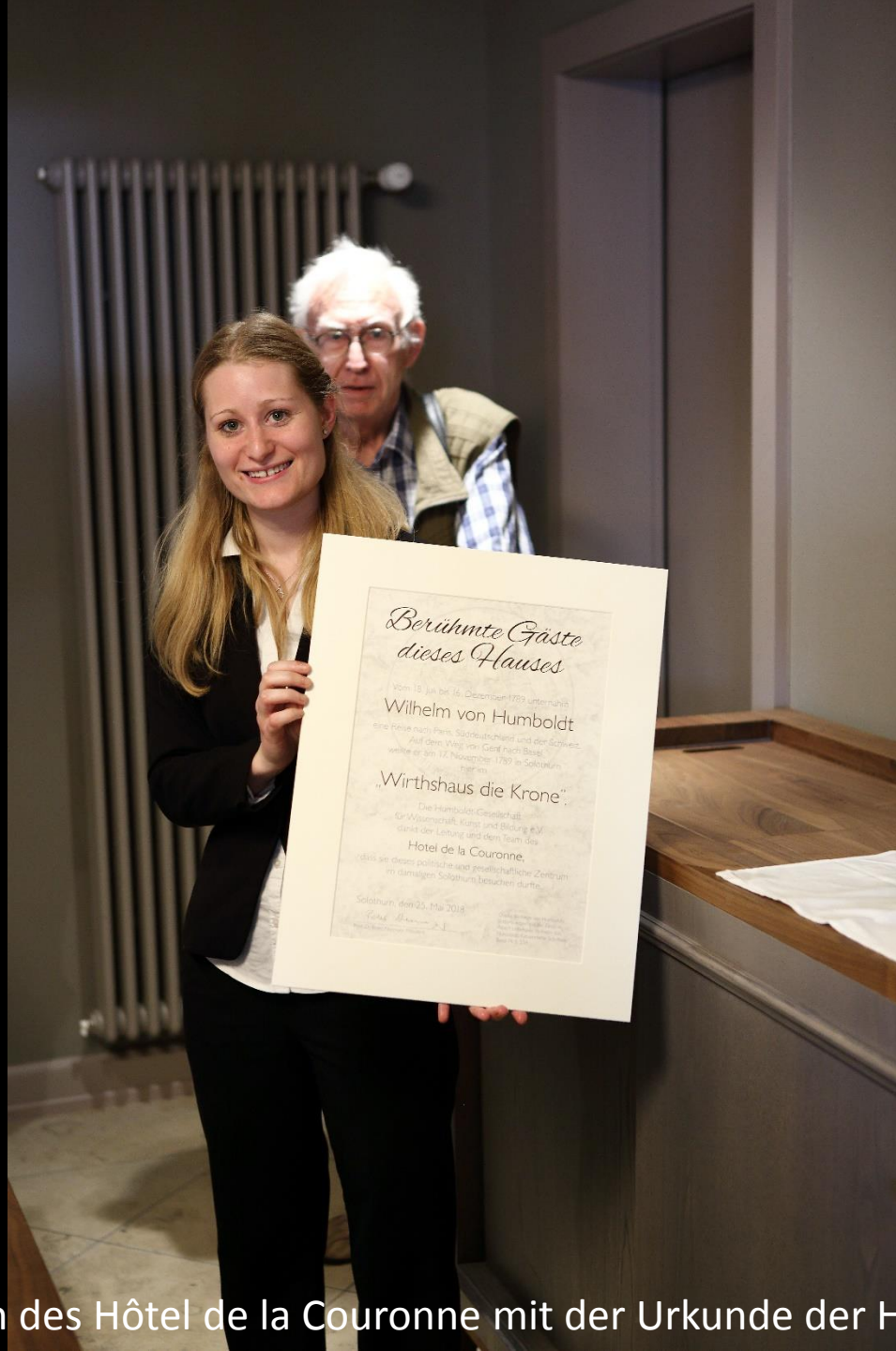
Die Reservationschefin des Hôtel de la Couronne mit der Urkunde der Humboldt-Gesellschaft