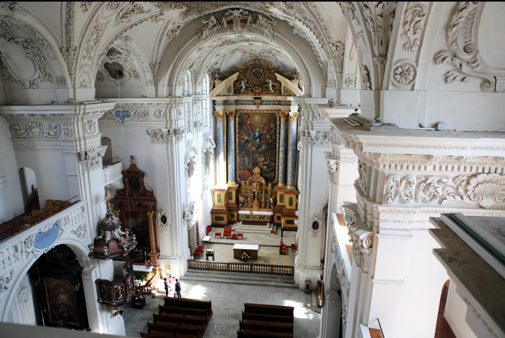
Blick in den Kirchenraum von dem Orgelplatz aus