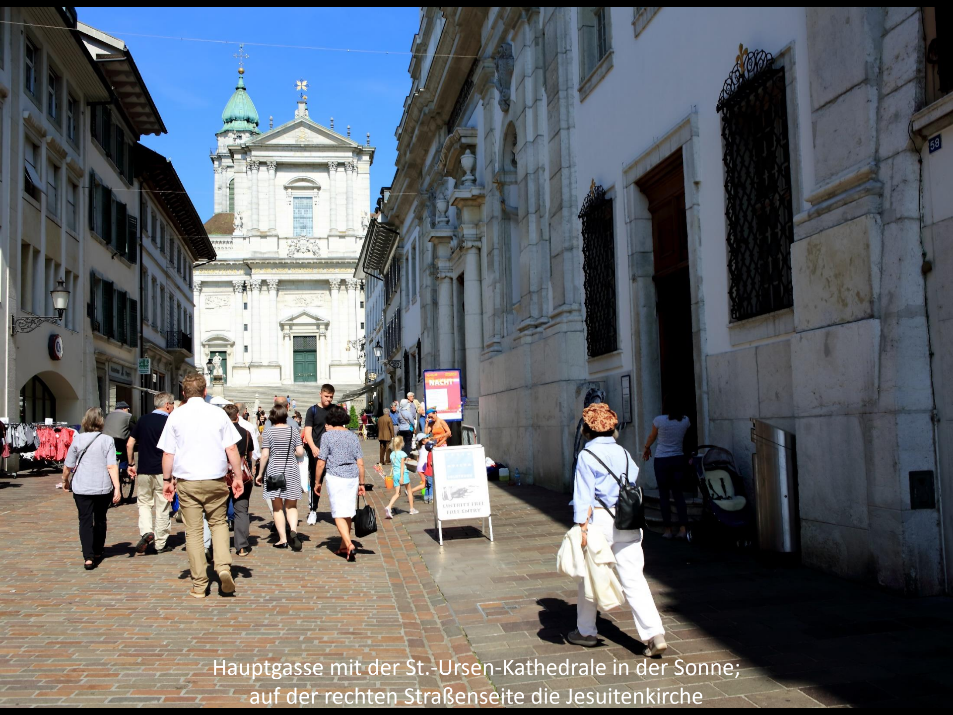
Hauptgasse mit der St.-Ursen-Kathedrale in der Sonne; auf der rechten Straßenseite die Jesuitenkirche