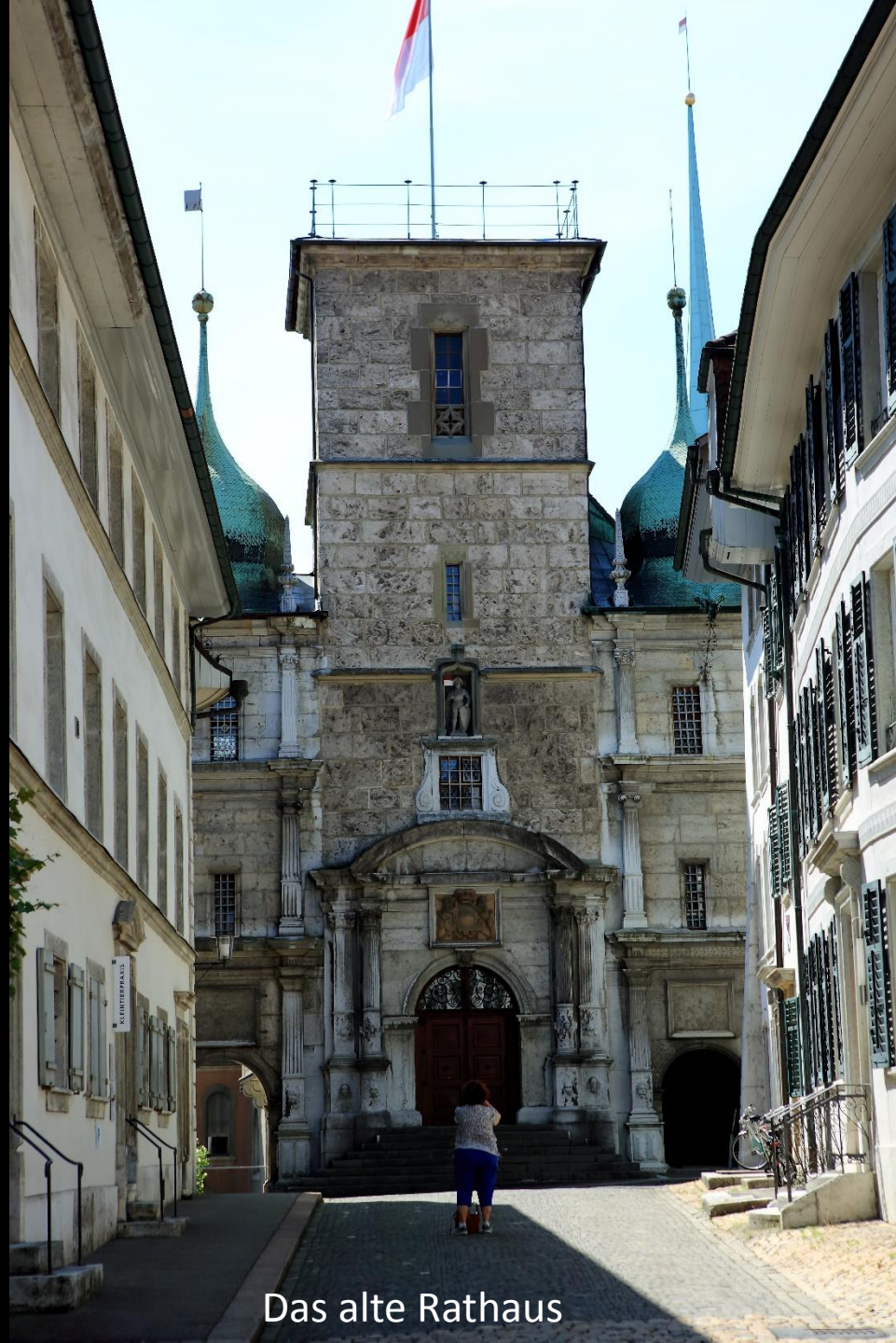
Das alte Rathaus