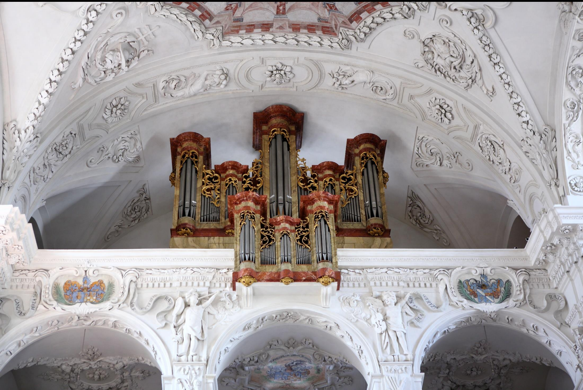
Franz Joseph Otter (1761–1807)