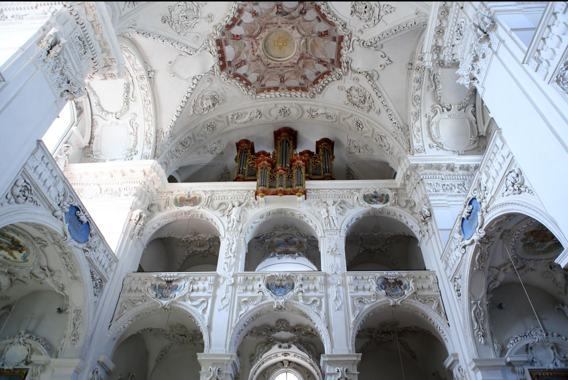
Die Orgel von Franz Joseph Otter (1761–1807)