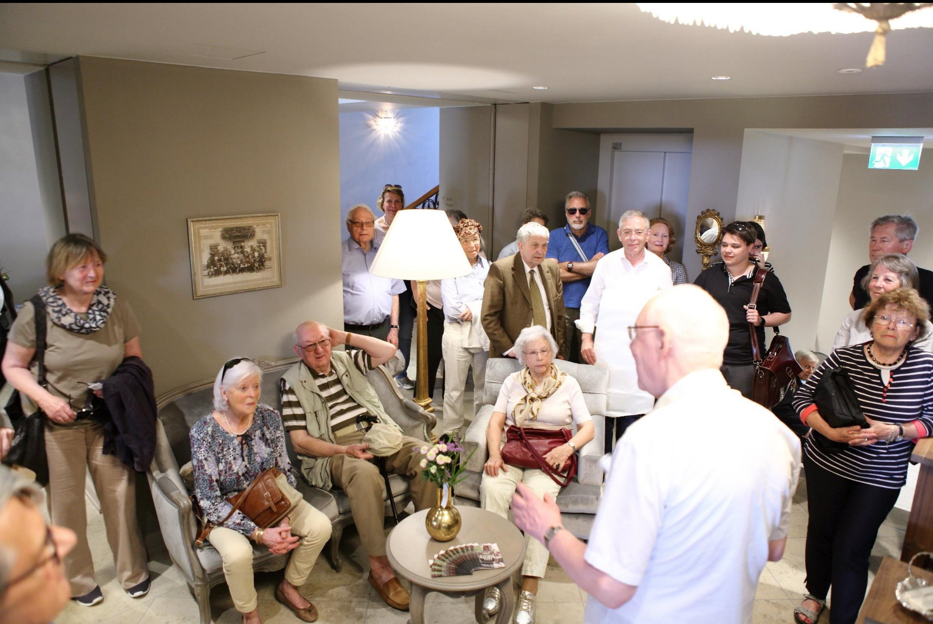
Vor der Reservation des Hôtel de la Couronne