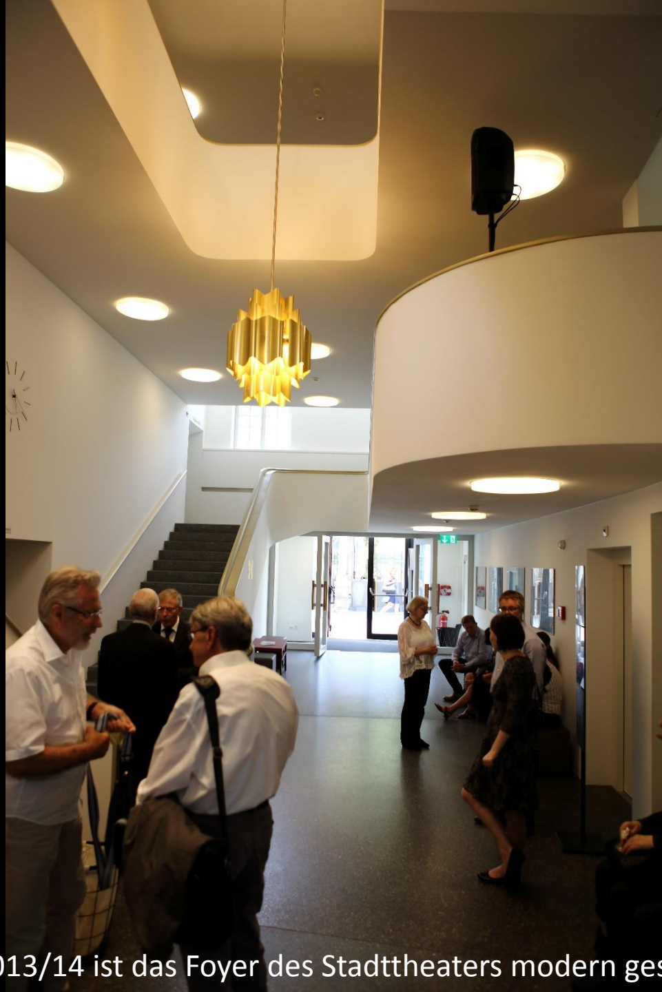
Beim Umbau 2013/14 ist das Foyer des Stadttheaters modern gestaltet worden ...