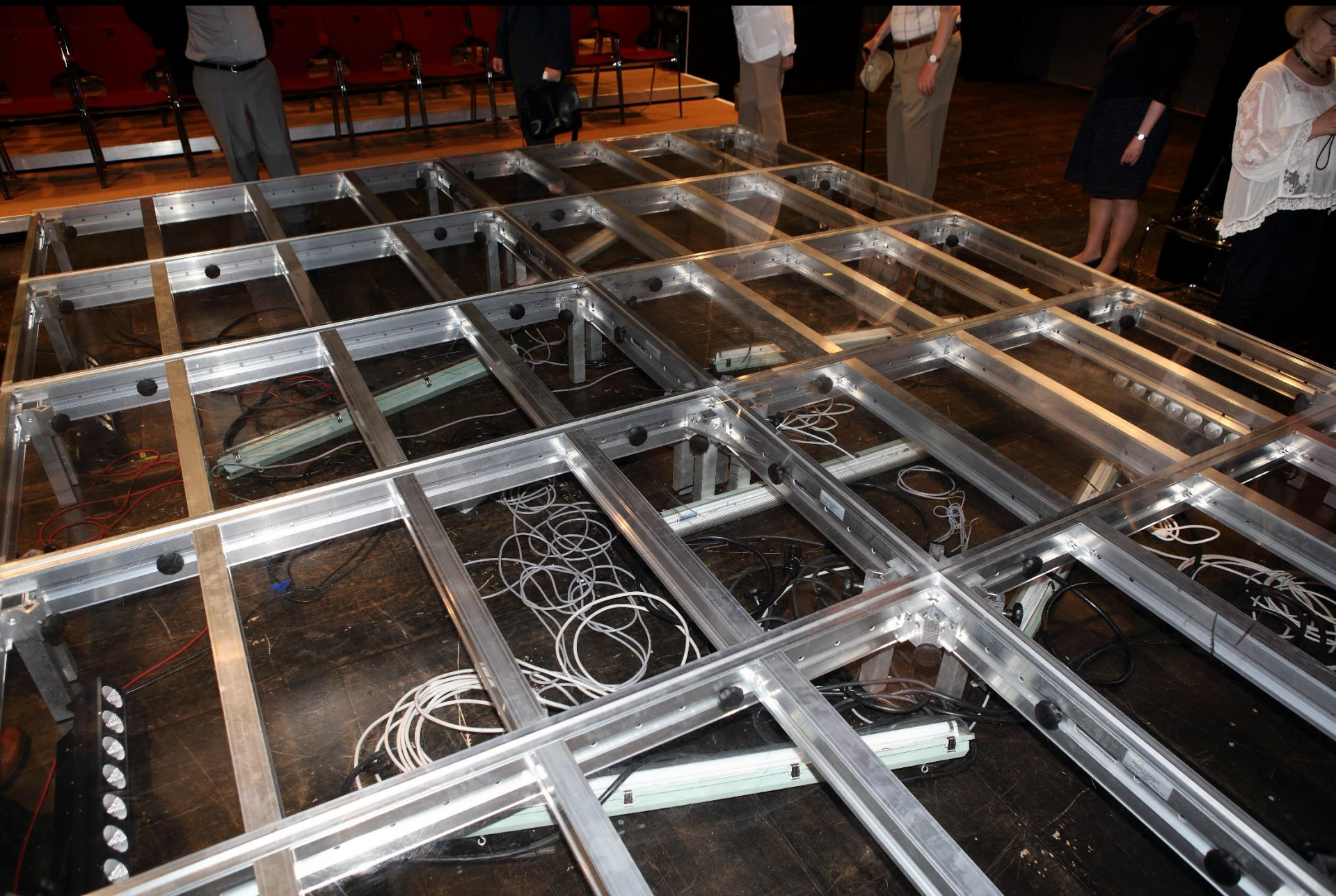
Bühneninstallation für das aktuelle Stück «Heilig Abend»