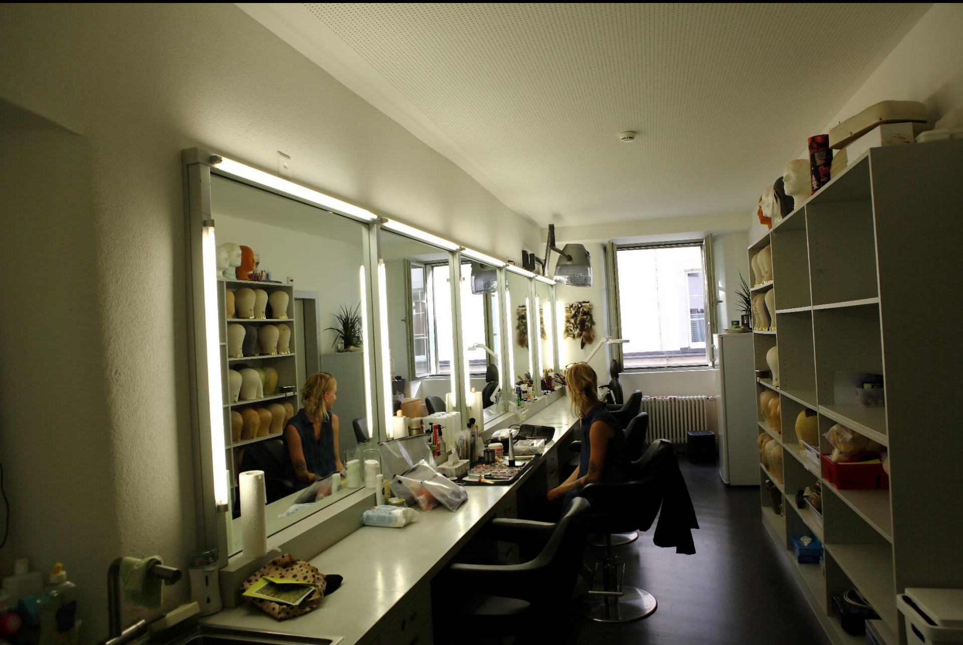
Ein Blick in die Theatergarderobe