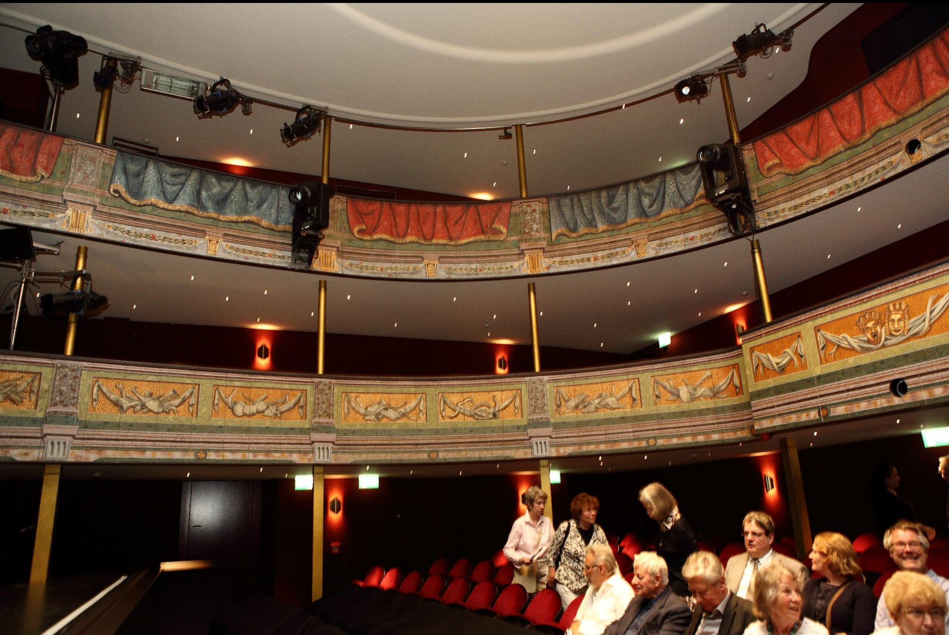
... und die originale illusionistische Vorhangmalerei der Ränge von 1778/79 bewundern ...