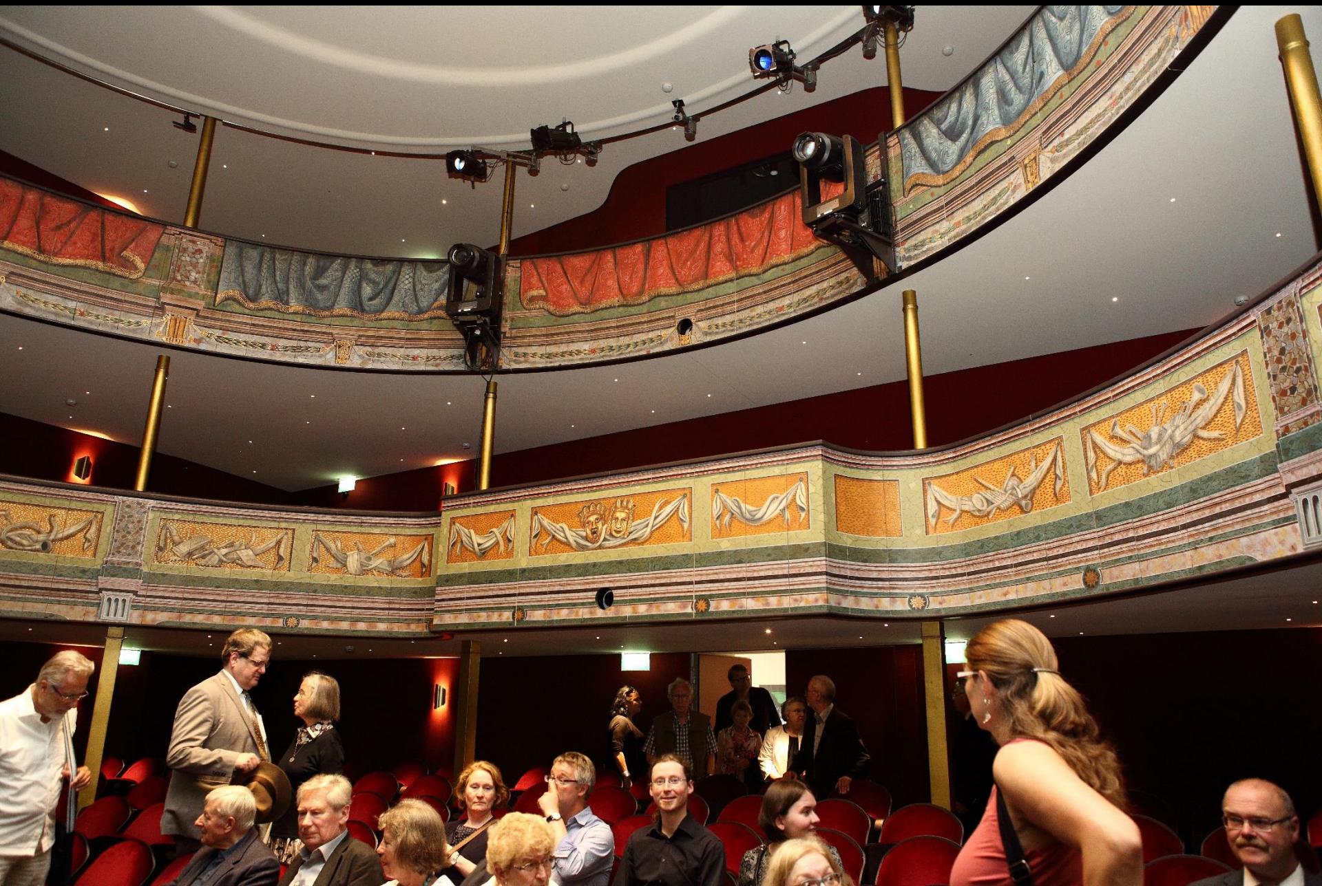
Die Mitglieder können sich den Theatersaal vor der Vorstellung ansehen ...