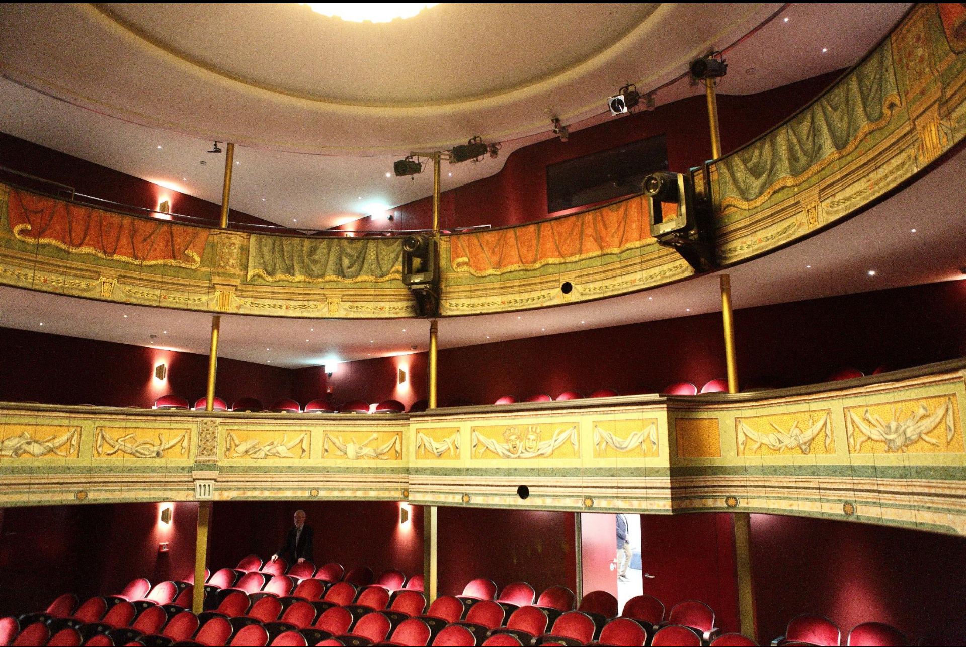
... der Theatersaal ist dagegen detailgenau restauriert worden