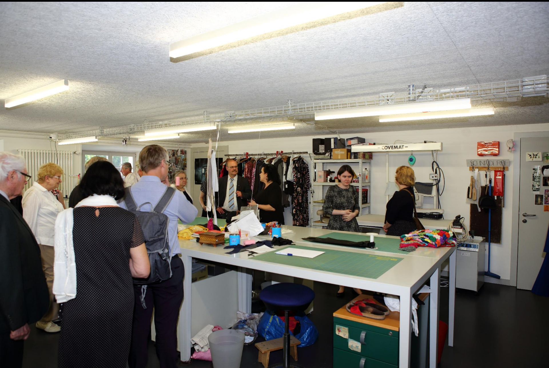
... und in die Kostümschneiderei