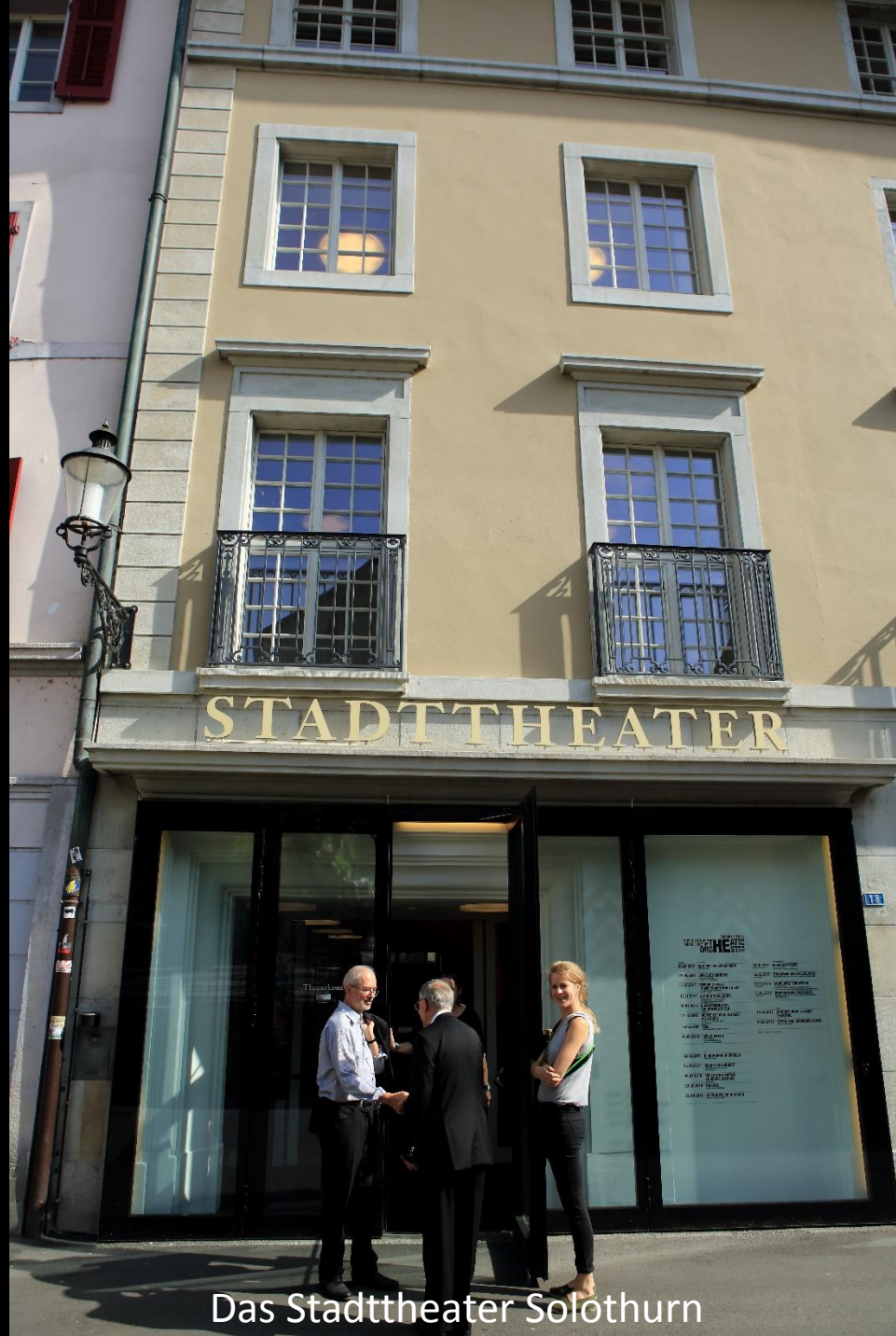
Das Stadttheater Solothurn